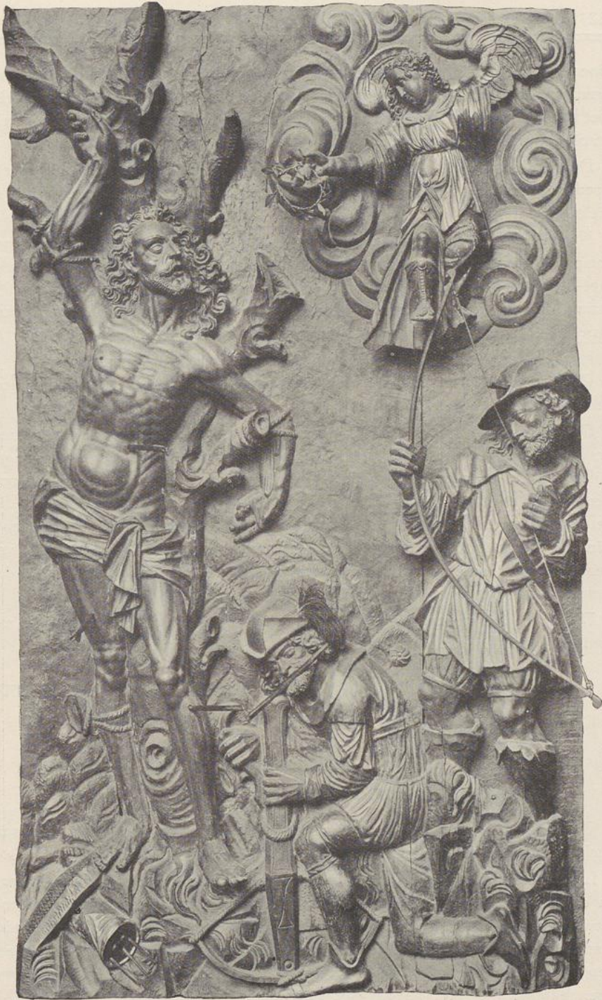
67. BARLEEF. ST SEBASTIAAN. XVI e EEUW