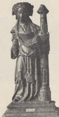
81. ST BARBARA XVI e EEUW