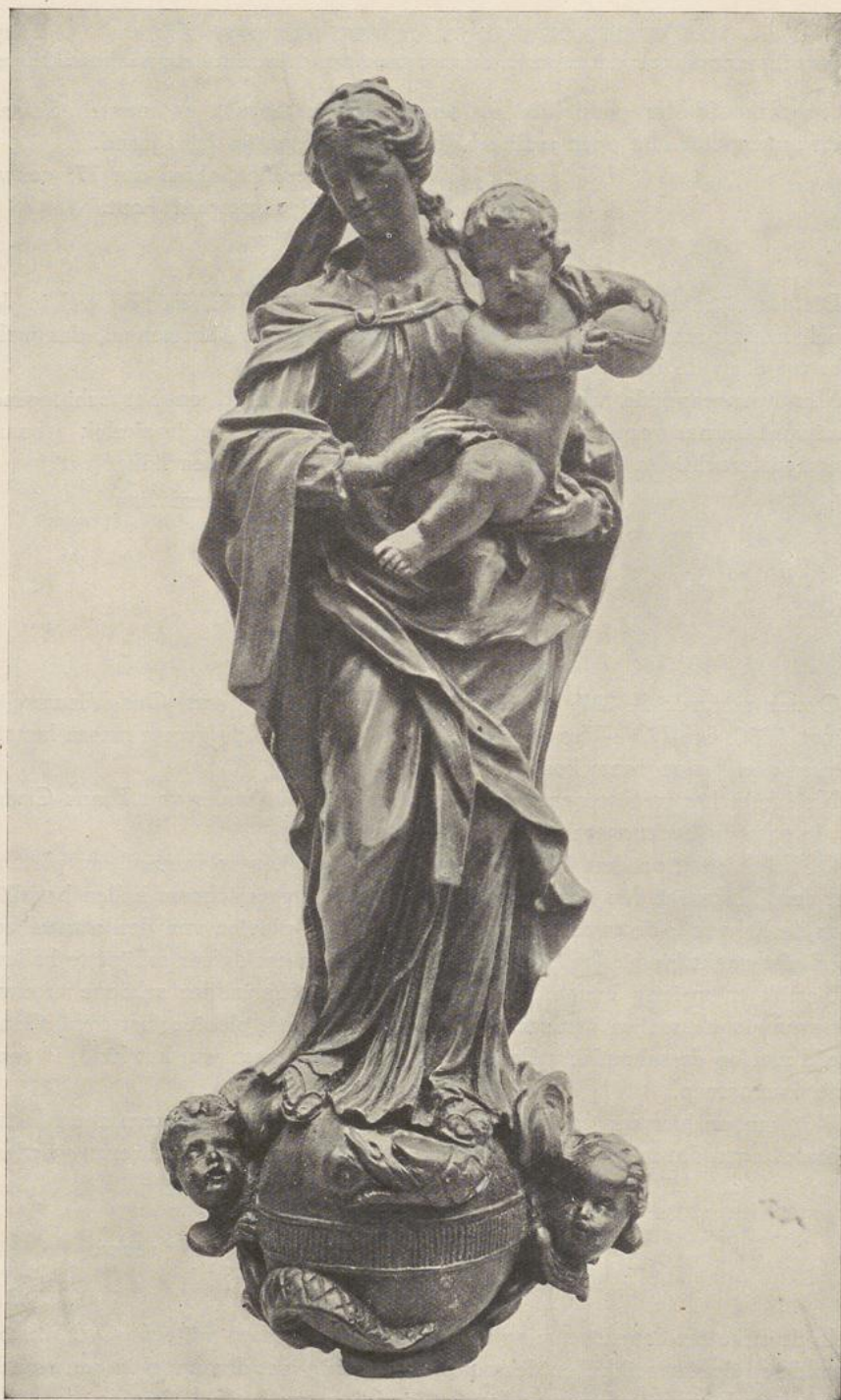
77. O. L. V. BEELDJE. PALMHOUT. XVII e EEUW