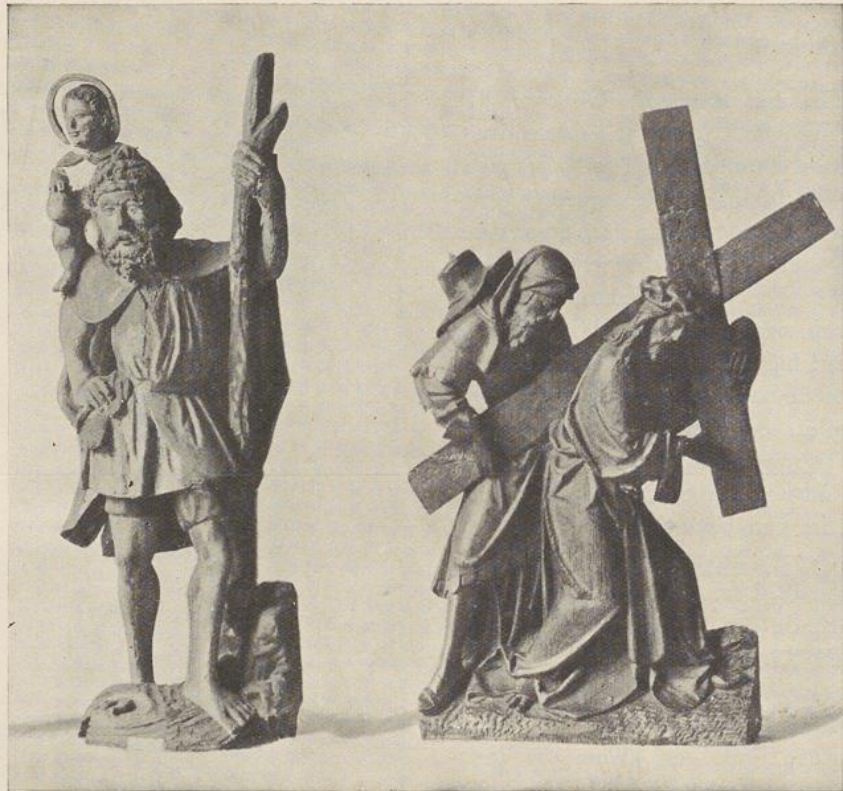
74. ST CHRISTOFFEL. XVI e EEUW

Op eenen fraai gebeeldhouwden toortsstengel aangebracht, staat Christoffel , den eenen voet in het water, met bloote beenen, kort opgestroopte broek, kleine tuniek en opgehouden mantel met schouderstuk, de gordel om de lenden. Op de schouders zit het kind Jezus met guitig aangezicht, en schijnt den wereld-