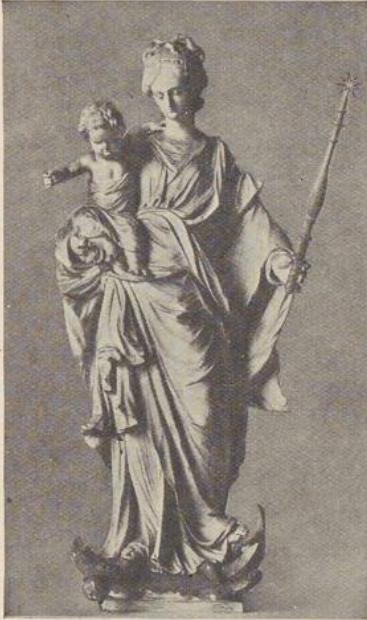
Cliché Van Herck 78. O. L. V. XVIII e EEUW

zinnebeeldig monster met een lang houten kruis af te maken. Om het evenwicht te houden steekt hij zijn linkerarmpje over de schouder zijner moeder. Deze slaat die beweging gade met licht gebogen hoofd.