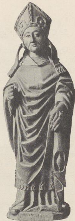
Cliché Van Herck 76. ST SEVERUS. XVI e EEUW