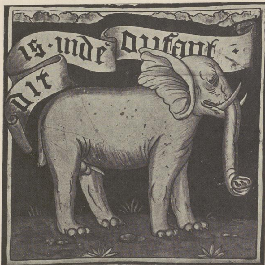
97. UITHANGBORD XVI e EEUW

op den gevel geschilderd, ofwel op een soort plaat aangeduid, die plat tegen den muur bevestigd was. De vooruitstekende uithangborden, die dwars over de smalle straten hingen, waren aldan nog niet zoozeer in voege. Deze tegelder zestiende eeuw. In dien tijd was de naam van het huis doorgaans ofwel