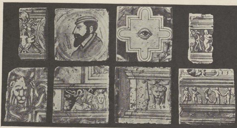
99. ANTWERPSCHE TEGELS XVI e EEUW

Van de aldaar tentoongestelde tegels, die deel hebben uitgemaakt van omlijstingen van Antwerpsche tegelplateaus, vermelden wij: 1° Een tegel gedagteekend 1544. Hij behoorde tot het onderste deel eener omlijsting en is versierd met een leeuwenkop. Teekening in 't geel op witten grond. (Pl. 99.) Gerepro-