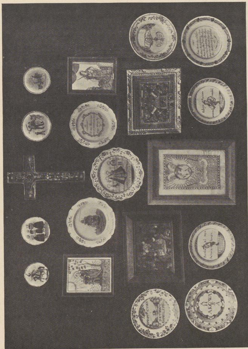
103. BEELDEKENS EN PLATEEL