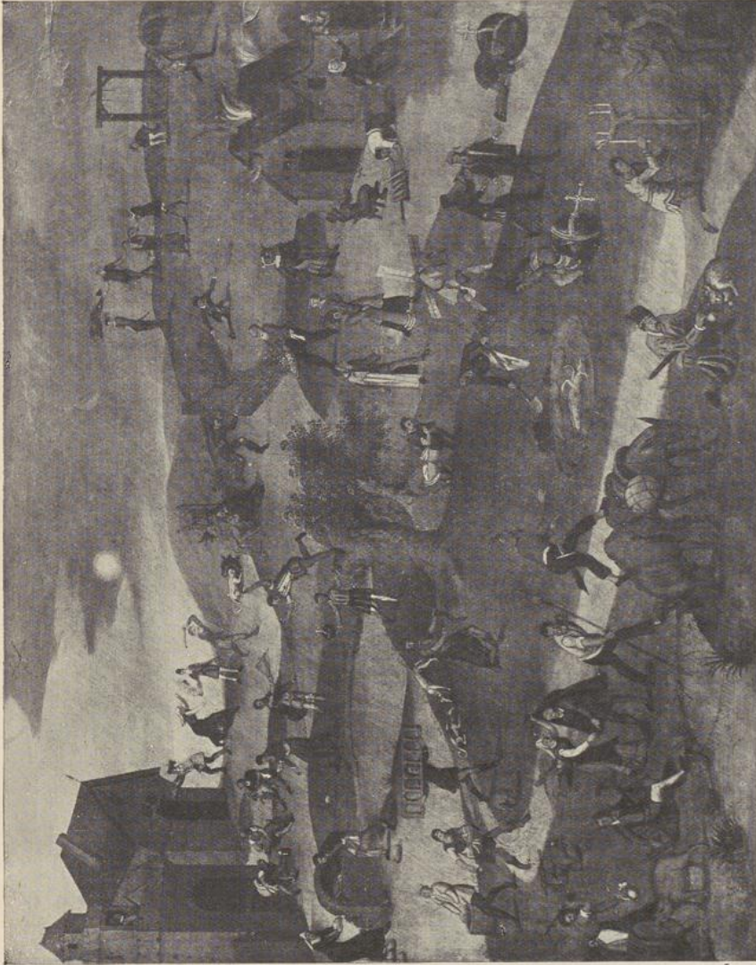
104. VLAAMSCH SPEEKWOORDEN