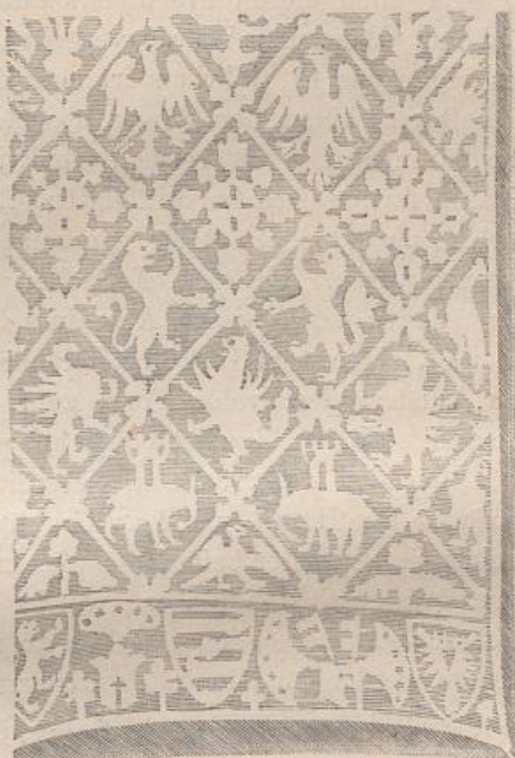
Fig. 218. Von einem Altartuch in München-Gladbach. 14. Jahrh. (Bock.)

Ueberaus wichtig für die künstlerische Entwicklung sind sodann die Bekleidungen der Seitenwände des Altars durch die sogenannten Antependien . Wie man dieselben schon in früher Zeit aus Prachtmetallen herzustellen liebte, haben wir oben S. 116 gesehen. Stand der Altar, wie es in der altchristlichen Zeit Sitte war, völlig frei, so wurden alle vier Seiten in ähnlicher Weise bekleidet; andernfalls erhielten die drei freistehenden Seiten ihr Antependium. Statt der kostbaren metallenen Antependien sah man sich aber häufig auf Werke mässigeren Aufwandes angewiesen, und zwar war es wieder die Stickerei, welche dabei zu reicher Anwendung kam. Ein solches auf Stramin in Flockseide gesticktes Antependium aus der zweiten Hälfte des 13. Jahrhunderts findet sich in der Kirche zu Goess bei Leoben. Es enthält in kreisförmigen Feldern die thronende Madonna mit dem Christuskinde, zu beiden Seiten die Ver-