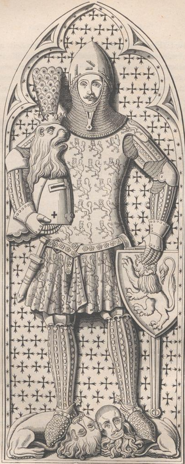
Fig. 184. Grabplatte Günthers von Schwarzburg im Dom zu Frankfurt a. M.