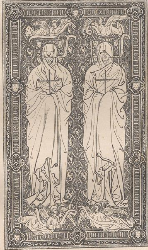
Fig. 185. Grabplatte in Brügge (nach Semper).

gräber mit Vorliebe die Reliefbehandlung wieder auf, wie zahlreiche Denkmäler im Dom und der Sepultur zu Bamberg beweisen. Aus dem 14. Jahrhundert dagegen ist in dieser Art das Grabmal des Erzbischofs Conrad von Hochstaden († 1261) im Dom zu Köln, ein