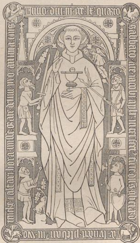
Fig. 183. Grabstein aus der Kirche zu Nossendorf.

Gerade an diesen stehenden Grabplatten hat die Kunst am glänzendsten ihre Fortschritte gezeigt und ihnen durch grössere Ausdehnung und architektonische Behandlung oft hohen Werth verliehen. Die Dome zu Würzburg, Mainz und Bamberg enthalten eine grosse Anzahl solcher Denkmäler, an denen sich die Entwicklung der Idee und der Ausführung vom 13. bis ins 16. Jahrh. beobachten lässt. Ein grosses Gesamtdenkmal dieser Art, welches acht Ritter und sechs Damen ans dem Ge-