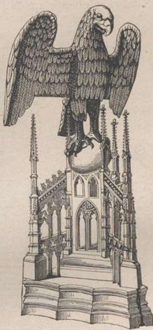
Fig. 190. Lesepult zu Aachen.

Ein dreiseitiger Ständer, von durchbrochenen Strebebögen und Strebepfeilern umgeben, trägt das Symbol des Evangelisten Johannes, einen Adler, der auf dem Rücken seiner ausgebreiteten Flügel Platz zum Auflegen des Buches bietet. Die Reinoldikirche und die Marienkirche zu Dortmund, das Münster zu Aachen (Fig. 190) und andere Kirchen besitzen noch jetzt solche Pulte. Ein treffliches Lesepult ähnlicher Art ist aus der Kathedrale von Lausanne in das Münster von Bern gekommen. Ein romanisches Betpult aus Sandstein, auf vier Würfelsäulen ruhend, sieht man in der Kapelle neben dem Kapitelsaal des Klosters Comburg bei Schwäbisch Hall. — Singepulte aus gothischer Zeit, in der Mitte des Chores aufgestellt, wurden aus Holz