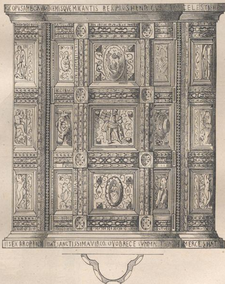
Fig. 187. Ambo aus dem Münster zu Aachen.

Kirche zu Wechselburg (Fig. 188), an welcher der thronende Erlöser zwischen Maria, Johannes und den Evangelistensymbolen, sodann Moses mit der ehernen Schlange, Kain und Abel mit ihren Opfergaben und Abrahams Opfer dargestellt sind. Eine ähnliche Kanzel steht in der Neuwerkskirche zu Goslar. Während in Italien die Kanzeln die