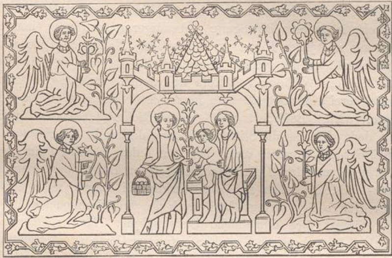
Fig. 217. Gothische Stickerei. (Bock.)

werke der Zeit ist das aus Pirna stammende Antependium im Alterthumsmuseum zu Dresden, die Krönung Mariä und verschiedene einzelne Heilige enthaltend. Nicht minder ausgezeichnet ist ein Antependium im Dom zu Salzburg, welches im feinsten Plattstich ausgeführt Scenen aus dem Leben Christi und seiner Mutter in zahlreichen Medaillons zeigt. Eine ganze sogenannte „Capelle“ d. h. eine Casel und zwei Levitengewänder hat sich in der Pfarrkirche zu Burtscheid bei Aachen erhalten. Noch vollständiger ist in der Kirche zu Goess bei Leoben in Steiermark eine aus Messgewand, zwei Dalmatiken, Stolen, Pluviale und Altarvorhang bestehende „Ca-