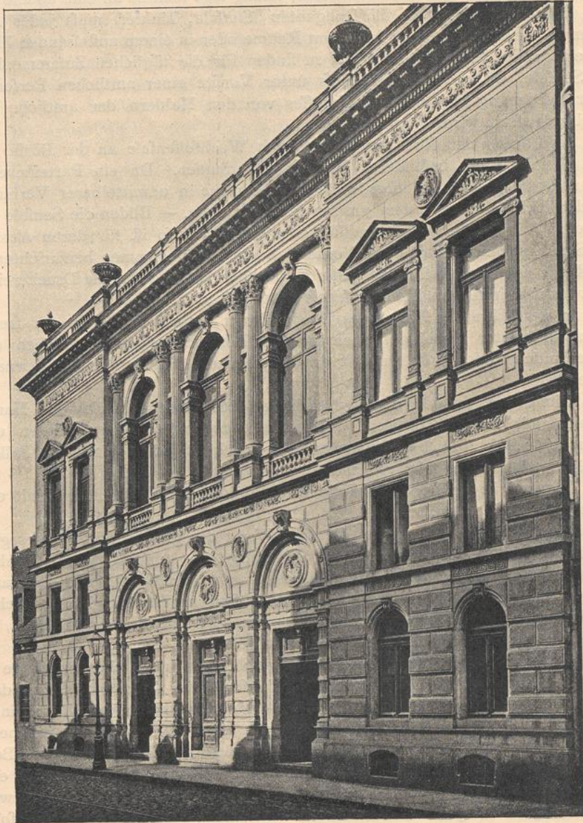
Börse zu Dresden.