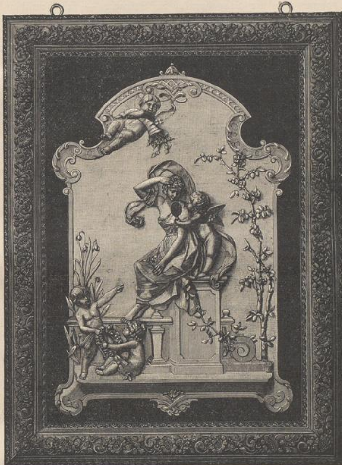
Figur 256. Bronzerelief im Rokokoſtil der Gegenwart von Prof. Harald Richter.

weiligen Farblosigkeit allerdings keine wohlthuende Wirkung auf das Auge ausüben konnte. Die Wiedereinsetzung der glasierten Kachelöfen in ihre alten Rechte war eine Konsequenz der Rückkehr zur Kunst des 16. Jahrhunderts, die bekauntlich in den nördlichen Ländern dem Ofen den wichtigsten Platz im Zimmer einräumte und ihm eine Form gab, die seinem Zwecke