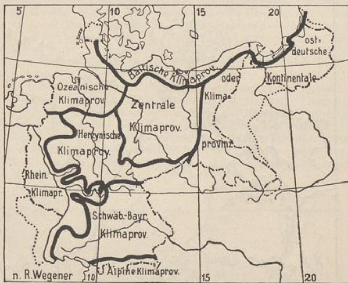
12. Die Klimaprovinzen Deutschlands.

Im norddeutschen Tiefland findet ein allmählicher Übergang statt. Die Nordseeküste nebst ihrem Hinterland trägt noch entschieden ozeanische Züge: östlich der Elbe wird das Klima immer kontinentaler. In Mittel- und Süddeutschland ist wohl auch ein ähnlicher Übergang vorhanden; aber er wird verdeckt durch die viel schärferen örtlichen Gegensätze. Schachbrettförmig wechseln hier Landschaften von ozeanischem und solche von kontinentalem Charakter miteinander ab, und dieser örtliche Gegensatz wird von großer geographischer Bedeutung, unter anderem durch seinen Einfluß auf die Bodenbildung. Namentlich ist es der fruchtbare Löß, ein Staubienerosionsprodukt aus diluvialer Zeit, der die kontinentalen Bezirke auszeichnet, während die ozeanischen Bezirke stark ausgelaugte Böden zeigen und zur Bildung von saurem Rohhumus und Ortstein neigen.