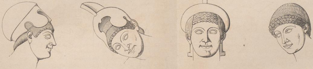
Fig. 13. Mittelgruppe des westlichen Giebels von Ägina.