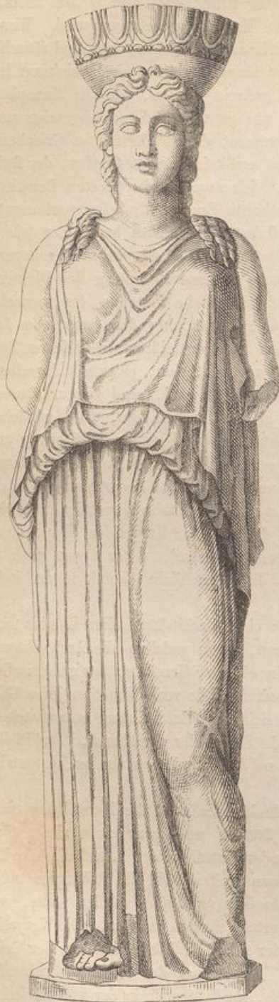
Fig. 50 a. Karyatide.