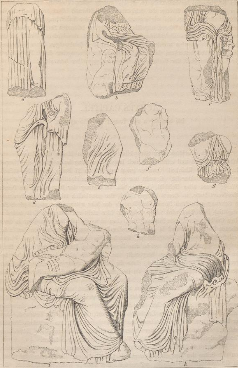
Fig. 51. Fragmente vom Fries des Erechtheion.