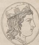
Fig. 55. Kopf der Here von einer argivischen Münze.

So weit die Schilderung der Herestatue, welche wir aus den flüchtigen Andeutungen der alten Schriftsteller entnehmen können; sie ist fast ganz äusserlich, und wir würden uns von Polyklet's Schöpfung, und besonders von dem durch ihn ausgeprägten Idealtypus nur eine sehr unvollkommene Vorstellung machen können, wenn wir nicht die erhaltenen Darstellungen der Göttin von Argos, wenn wir ganz besonders nicht den auf der unten folgenden Tafel (Fig. 56) nach einem Gypsabgusse neu gezeichneten Kolossalkopf der Villa Ludovisi zur Ergänzung herbeiziehn dürften. Das Recht, dies zu thun, glaube ich mir durch einen eigenen Aufsatz über das Verhältniss der ludovisischen Büste zu Polyklet's Here gewahrt zu haben 91 ), in welchem ich gegen neuerdings laut gewordene Zweifel dargethan zu haben denke, dass wirklich Polyklet den Idealtypus der Here feststellte, und dass wir diesen in denjenigen Darstellungen anzuerkennen haben, welche in den charakteristischen Idealzügen mit einander übereinstimmen, deren vollendetste und schönste aber in der hier abgebildeten Büste erhalten ist. Ehe wir aber diesen wundervollen Kopf näher betrachten, muss noch eine Bemerkung über Polyklet's Werk vorangeschickt werden.