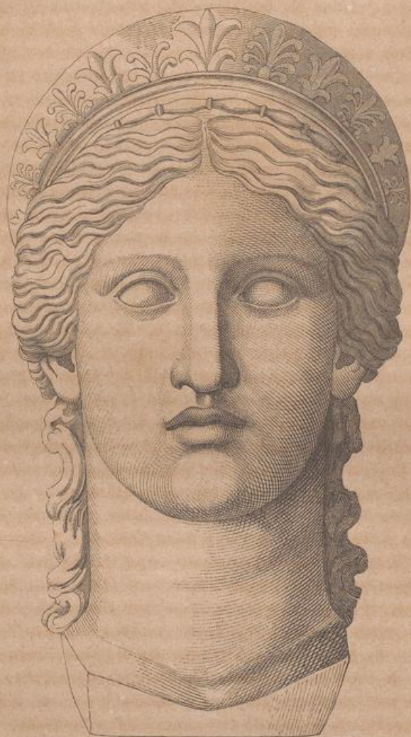
Fig. 56. Büste der Here in der Villa Ludovisi.