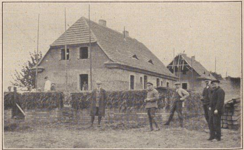
Abb. 4: Der fertige Rohbau.