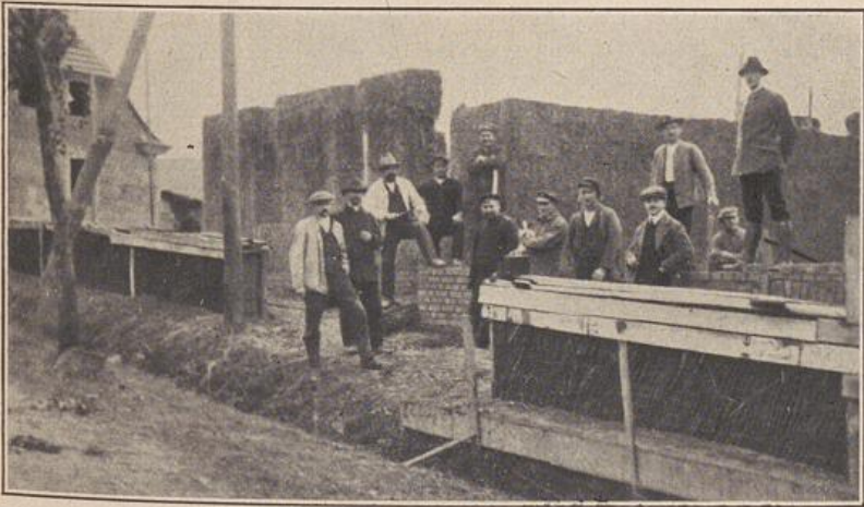
Abb. 2: Die rohe Wand, „der Saß“, vor dem Abstich mit dem Spaten.