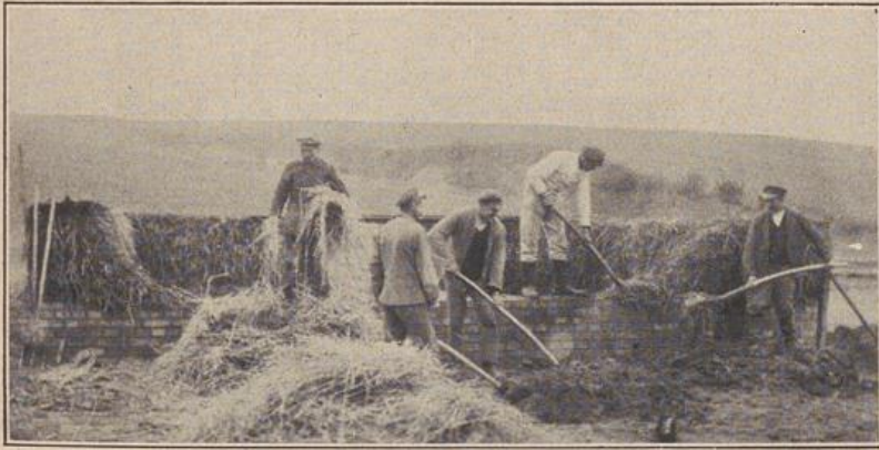
Abb. 1: Die Lehmwellerwand wird aufgebracht. Im Vordergrund der Pfuhl, in dem das Stroh mit dem Lehm gemischt wird.

Abbildungen zu dem Aufsatz: Der Lehmwellerbau und die Selbsthilfe. Von Regierungsbaumeister Köster, Eisleben.