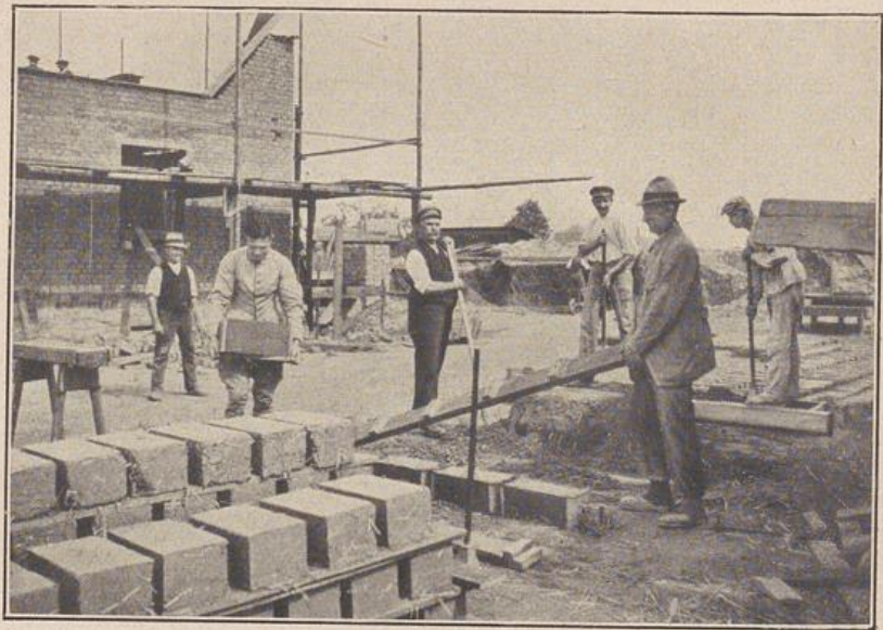
Abb. 3: Herstellung der Lehmquadern.