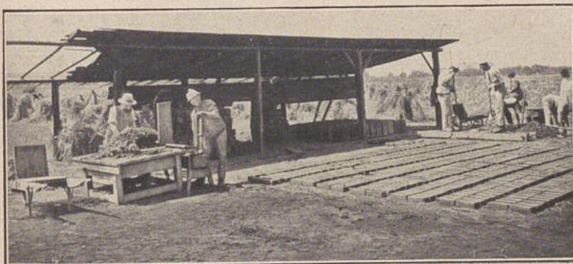
Abb. 1: Herstellung der Lehmziegel (Grünlinge).

Abbildungen zu dem Aufsätze: Lehmbackurse. Von Direktor Wagner, Sora (N.-L.) Lehmbackurse des „Deutschen Ausschusses zur Förderung der Lehmbackweise“ in Reich 1920.