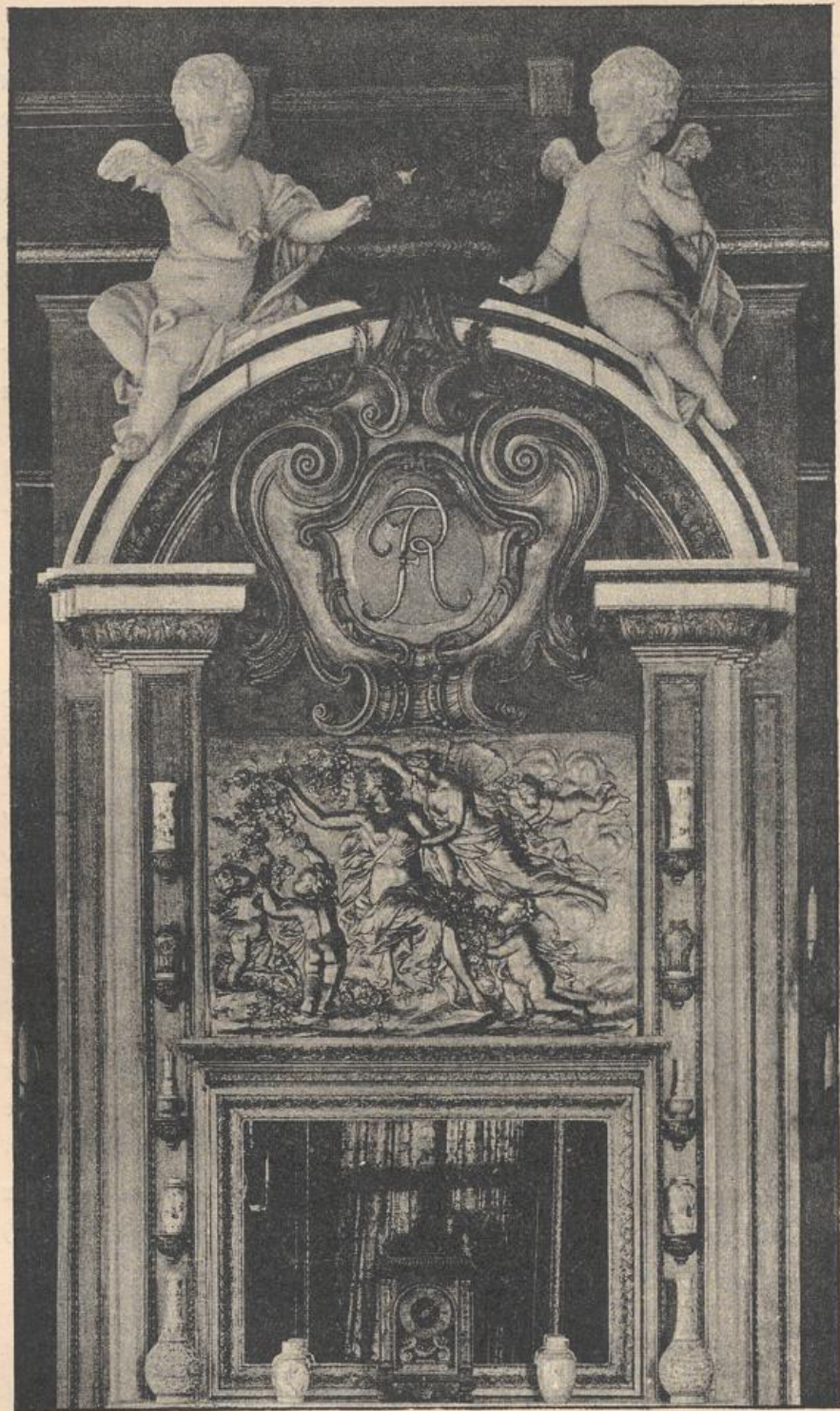
fig. 28. Schloß zu Charlottenburg, Kaminanzsatz im Speisesaal.