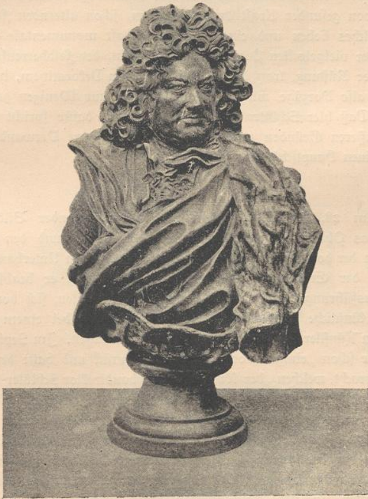
fig. 54. Büste des Landgrafen Friedrich von Hessen-Homburg.

werk, welches sich in Homburg vor der Höhe als dekorativer Schmuck eines Schloßthores, als sogenanntes „Schwarzes Männchen“ ver-