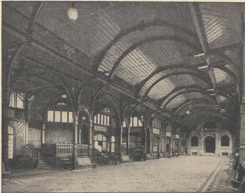
Trinkhalle zu Bad Flinsberg 47) .