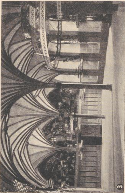
Schloß Marienburg in Westpreußen.