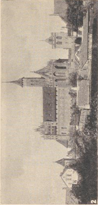
2. Ansicht von Osten. 4. Hof des Hochschloßes.