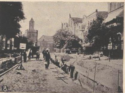
1. Vier Schwiegermütter. 2. Reigen junger Mädchen. 3. Hochzeitsmusikanten. 4. Rathaus in Zduny. 5. Neumark Wpr. im Druwenztal. 6. Brabetal bei Krone. 7. Brand in den Graudenzser Verteidigungswehramt. 8. Kanalisationsarbeiten auf dem Markte in Marienburg.