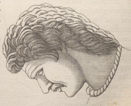
Fig. 79 a. Kopf des sterbenden Galliers.

Es ist das Verdienst des italienischen Gelehrten Nibby, in der Statue des sogenannten „sterbenden Fechters“, von der wir eine nach dem Gyps gefertigte Zeichnung (Fig. 79) beilegen und von deren Kopfe wir hierneben eine Profilansicht (Fig. 79 a) mittheilen, einen Gallier erkannt und nachgewiesen zu haben, obwohl er die Stelle des Plinius, von der wir ausgegangen sind, übersah, und