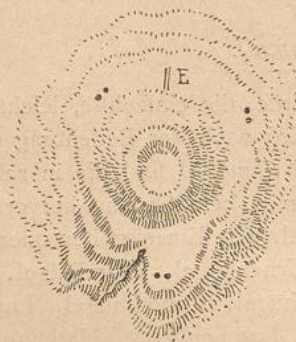
und bei Sesonk.

nommen, ohne dass indessen Nachgrabungen Beweise für diese Annahme erbracht hätten.