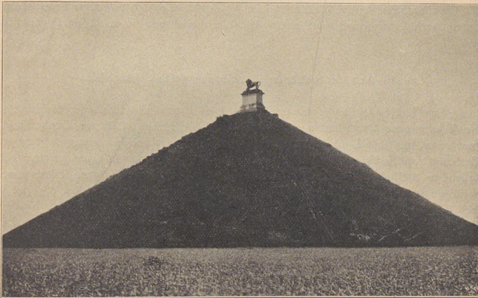
Hügel und Löwe von Waterloo.

aus 7 bis 8 Steinlagen bis zu 10 m hoch geschichtet und ausgemeißelt sind; sitzende Kolosse mit Relieftafeln, Löwen und Adlern wechseln ab.