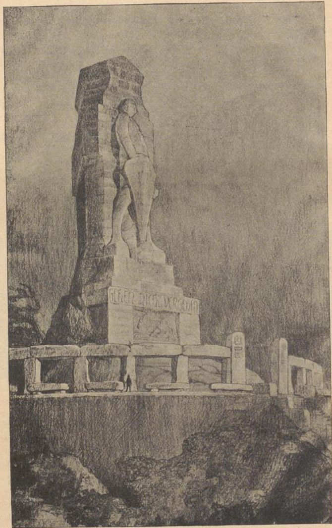
Schmitz' Entwurf für ein Bismarck -Denkmal zu Hamburg.

Ein Wiederherstellungsversuch ist in der unten genannten Zeitschrift 115) gemacht. Ein Bild des einen Steingeheges in Salisbury gibt Fig. 4, die aber leider keinen Menschenmaßstab enthält, so daß die Größe des Eindruckes nicht gewürdigt werden kann.