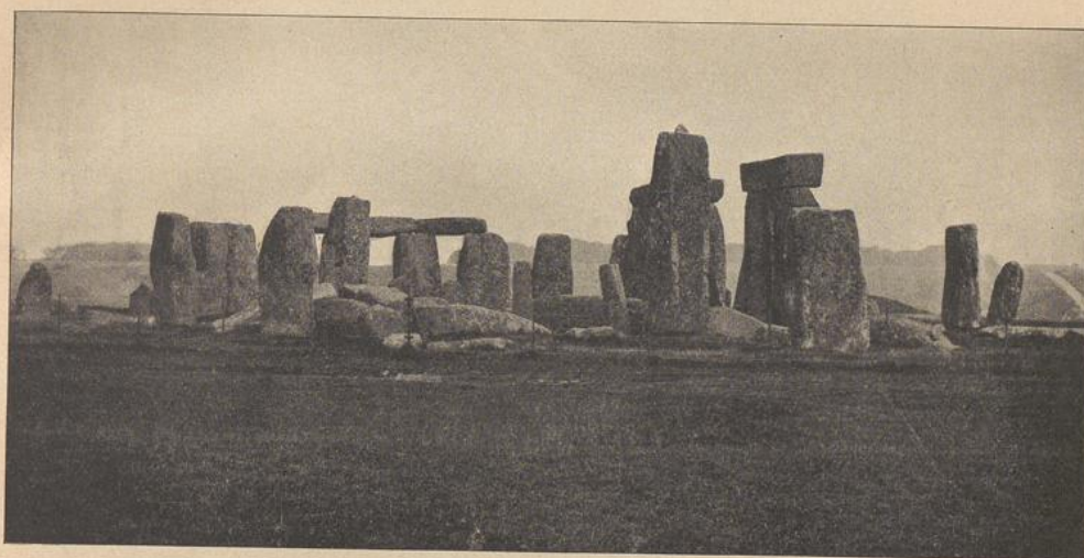
Steingehege zu Salisbury.