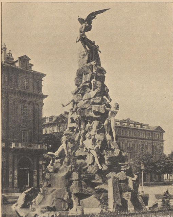
Denkmal zur Erinnerung an den Durchstich des Mont Fréjus zu Turin. (Mont-Cenis-Tunnel.)

erfaßt und jede Heldenpose, jede verfeinerte Phrase vermieden. Ein Wahrzeichen der Heimatliebe, hebt sich das Monument aus dem Immergrün der tiefdunklen Wälder und bringt uns sofort in eine persönliche Beziehung zu dem Manne, den es feiern will.« ( Blumenthal .)