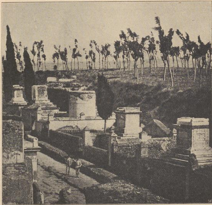
Gräberstraße zu Pompeji.

Heidecharakter gegeben. Zwischen kleineren Findlingen, die dem mächtigen Steine vorgelagert sind, sind Wacholder, Krummholzkiefern u. s. w. angepflanzt.