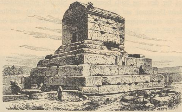
Grab des Kyros bei Mefcheb-i-Murghab.

werden. Die strukturelle Behandlung des Obelisken, als aus rauhem Boffagemauerwerk gefchichtet, war ein Mittel, die naturgemäße Ungleichheit der gestifteten Steine künstlerisch zu verwerten.