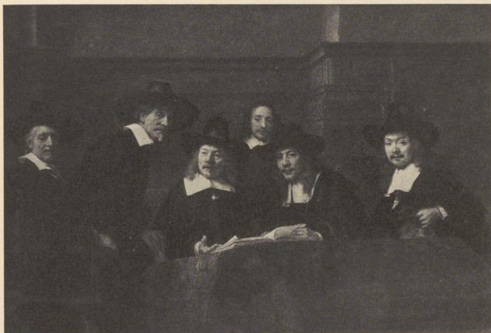
Rembrandt, Die Staalmeesters (1661).

3. Alle Wirkungen sind relativ. Dieselbe Form bedeutet nicht zu allen Zeiten das gleiche. Die Vertikale im Porträt der Klassik hat einen anderen Sinn als die Vertikale im Porträt der Primitiven. Hier ist sie die einzige Darstellungsform, dort hebt sie sich ab von anderen Möglichkeiten und gewinnt dadurch einen eigentümlichen Ausdruck.