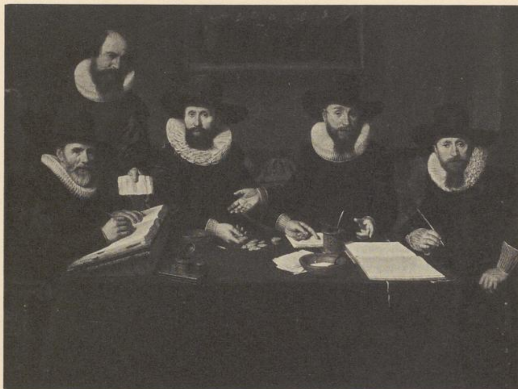
Nik. Elias, Regentenbild (1628).

sichtbaren Handlung annimmt? Im 19. Jahrhundert scheint man darüber allerdings anders gedacht zu haben.