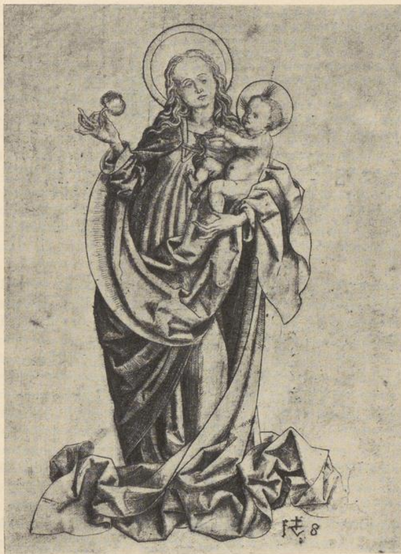
Veit Stoß, Maria mit Kind.

der Folge des Ablaufs seiner Geschichte zum Inhalt haben: es ist der David nach der Tat, sagt man, denn der Goliathkopf liegt ihm zu Füßen; sein Blick soll sogar auf diesen Kopf gerichtet sein, woraus man dann Schlüsse auf die Gedanken zieht, die den Knaben in diesem Augenblick bewegen mögen. Die andere Deutung aber steht auf dem Boden, daß wir es hier überhaupt nicht mit der Darstellung eines vorübergehenden Moments zu tun haben, sondern mit dem Bild des Siegerknaben David in bleibender Gestalt, dem der Kopf des Goliath nur