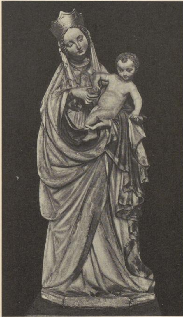
Maria mit Kind.