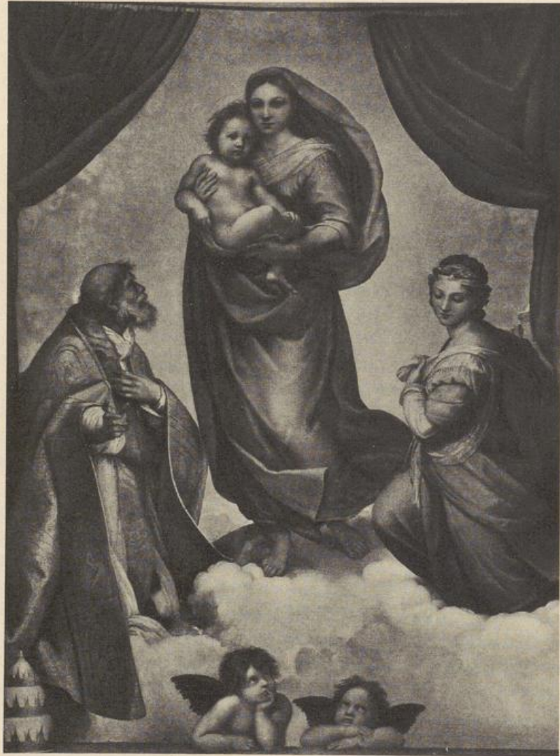
Raffael, Sixtinische Madonna.

die geschlossene Gruppe der Bäume in ihrer Vertikalität gibt dem Ganzen einen Akzent von Energie, der sich merkwürdigerweise in der Umkehrung verliert, trotzdem der große Gegensatz der Senkrechten und Waagrechten ja nicht angegriffen wird. Aber sobald eben die Waagrechte der Ebene auf die rechte Seite zu liegen kommt, wird sie die stimmungsmäßig entscheidende Form. Die Bäume sind entwertet und der Akzent liegt auf der ruhenden, endlos sich deh- nenden Fläche.