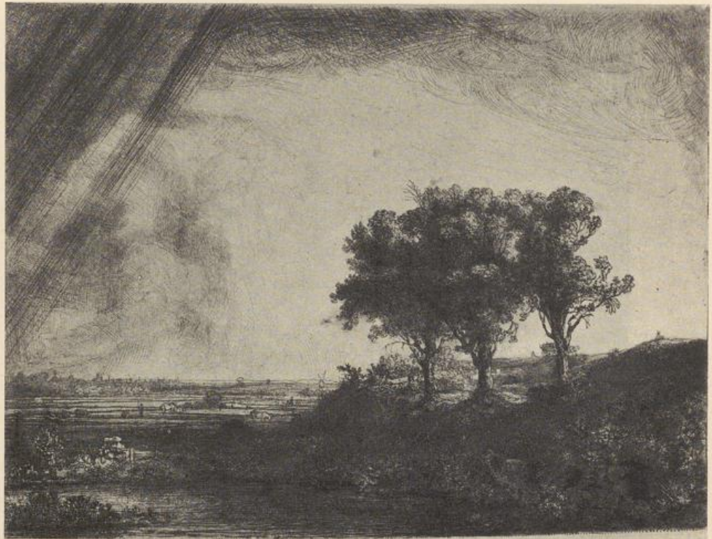
Rembrandt, Landschaft mit den drei Bäumen.

Zimmer sauber und hell und aufgeräumt ist, tut es aber nicht allein, denn sobald man das Bild umkehrt, verflüchtigt sich die «sonntägliche» Stimmung, und die Leserin sitzt unbehaglich, wie verloren in ihrer Stube. Offenbar sprechen auch hier Richtungsfragen entscheidend mit: es ist wichtig, daß auf der rechten Seite die Formen reich und zierlich sind, daß dort die hellen Sonnenflecken spielen, daß dort die starke Farbe sich entzündet. Kommen diese Dinge auf die andere Seite, so liest man darüber hinweg wie über eine mehr oder weniger gleichgültige Einleitung, und das Ungefüllte des rechten Bildabschlusses, wie es sich dann ergibt, genügt, die Stimmung der ganzen Szene zu verderben.