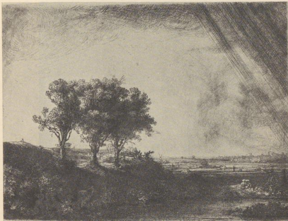
Rembrandt, Landschaft mit den drei Bäumen (seitenverkehrt).

Stille und Befriedung, weil von den gewählten Formen alle lauten und unruhigen links bleiben und rechts die Erscheinung ins Klare, Begrenzte, Durchgebildete mündet. Unruhig wirken die Bogenfenster, unruhig die Überschneidungen, unruhig vor allem die Flucht der großen Wand, während auf der andern Seite schon durch den Löwen und den eckfüllenden Kürbis (um von anderem zu schweigen) für den Eindruck des Beschlossenen gesorgt ist. Man kann auch diese Komposition nicht umkehren, ohne ihr ihren Zauber zu nehmen. Selbst wenn keine anderen Formen hineinspielen, verschiebt sich eben die Wirkung aufs gründlichste dadurch, daß die sekundären Motive auf die guten Plätze kommen.