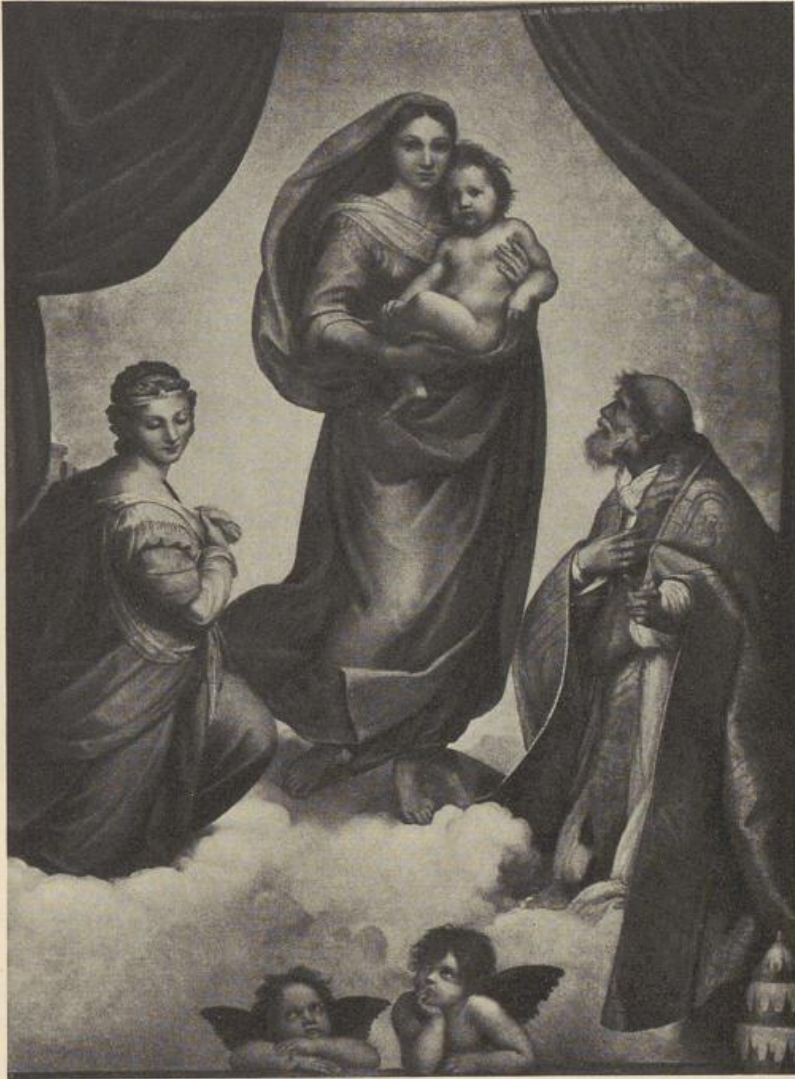
Raffael, Sixtinische Madonna (seitenverkehrt).

In anderen Radierungen, die das Typische der holländischen Flachlandschaft anklingen lassen sollen, hat Rembrandt diese Ebene nach rechts verlegt, und dort ist das Motiv dann natürlich ganz an seinem Platz.