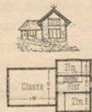
Fig. 98 45) .