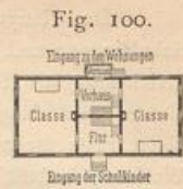
Typus einer zweiclassigen Volksschule.

Die Aborte befinden sich stets in besonderen Bauten im Hofe. In manchen Fällen wird ein Versammlungssaal für die Gemeindeverwaltung mit dem Schulhaufe vereinigt.