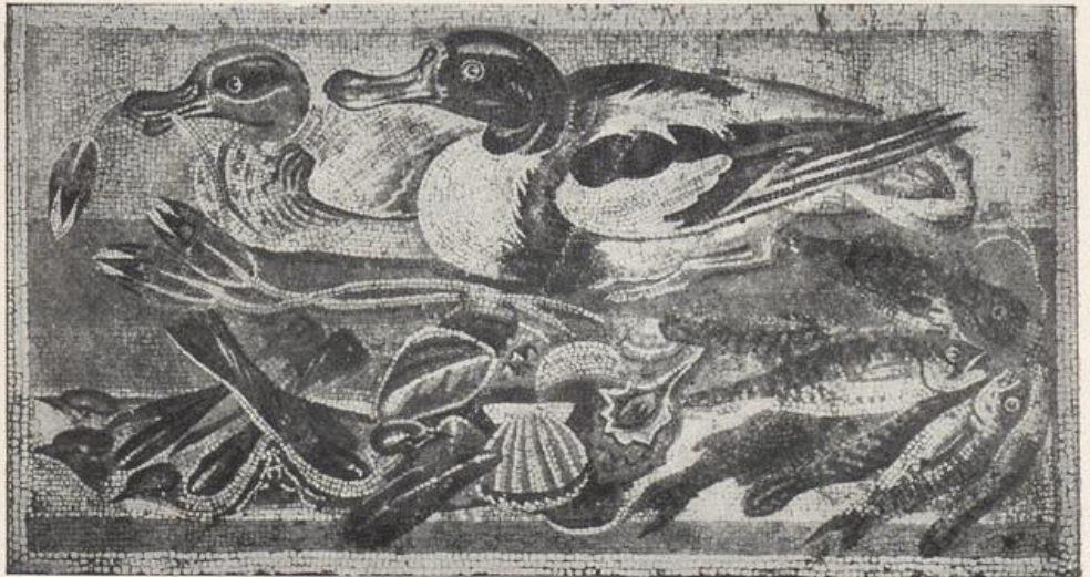
11. Eine Speisekarte in Mosaik Pompeji