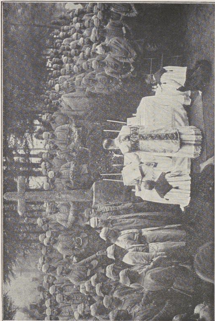
Eine Feldmesse in den Vogesen.