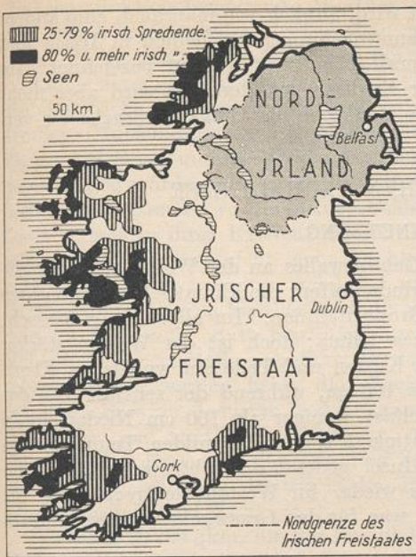
517. Die irisch sprechende Bevölkerung.