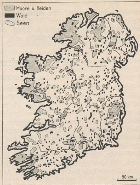
518. Moore, Heiden, Wälder und Seen in Irland.