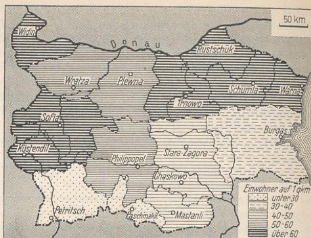
942. Bevölkerungsdichte Bulgariens nach Verwaltungsbezirken.

Die Bevölkerungsdichte Bulgariens ist größer als die von Südslawien. Sie beträgt dort 48 Menschen auf den Quadratkilometer, in Bulgarien hingegen 53. In den 16 Verwaltungsbezirken (bulgarisch „Okrug“) ist die Dichte durchaus verschieden. Die höchste Ziffer hat Sofia mit 70, die niedrigste Paschmakli mit 25. Die Verwaltungsbezirke der Donautafel, dazu die Beckenflächen von Sofia und Küstendil weisen die dichteste Bevölkerung auf. Die Bevölkerungsverteilung auf die einzelnen „Okrugs“ zeigt Abb. 942 u. Tab. 19a, S. 1192.