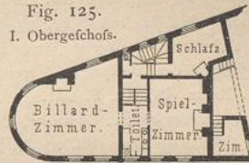
Fig. 125. I. Obergechofs.

Kaffee-Palast und Arbeiterhalle zu Kenfal-Green 100 ). 1/500 n. Gr. Arch.: Boucher.