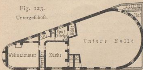
Fig. 123. Untergechofs.