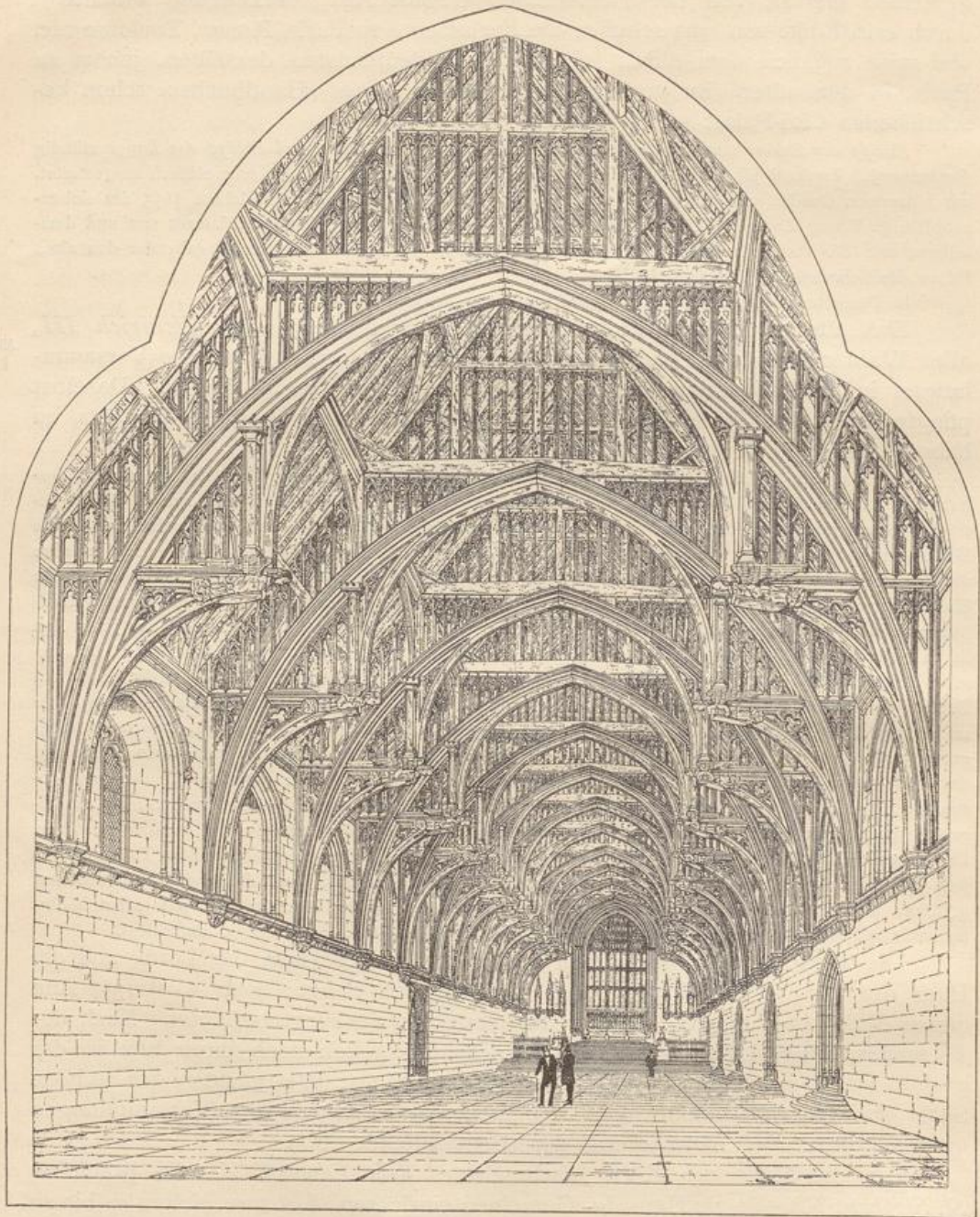
Westminsterhalle zu London 8) .

Diese Kapelle, von Edward I. 1298 begonnen und von Edward III. 1348 vollendet, war ein Werk von außerordentlicher Schönheit 11) , das mit der ungefähr ein Jahrhundert früheren Sainte-Chapelle zu Paris zu vergleichen ist.