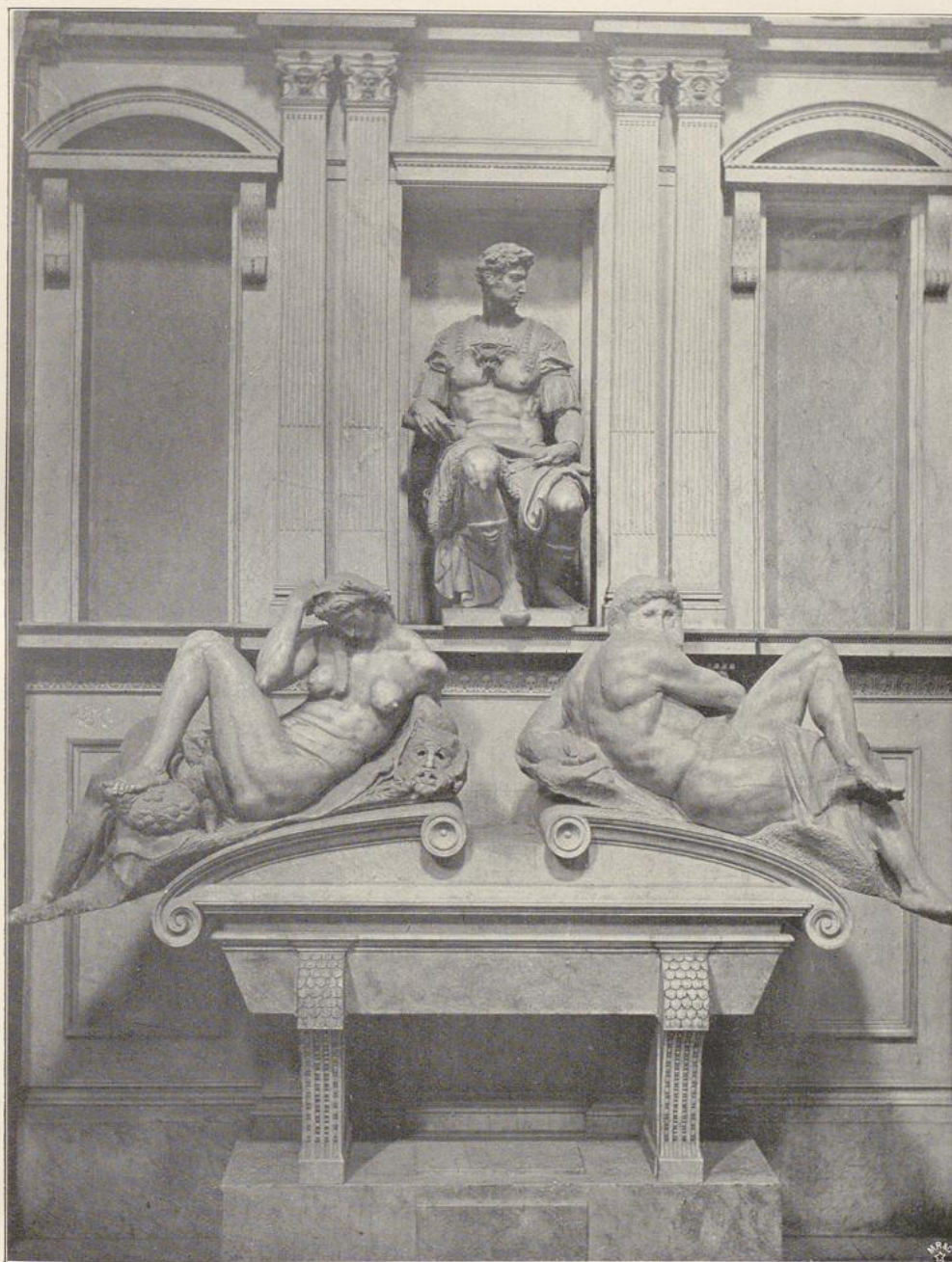
Denkmal des Giuliano de' Medici in San Lorenzo zu Florenz.