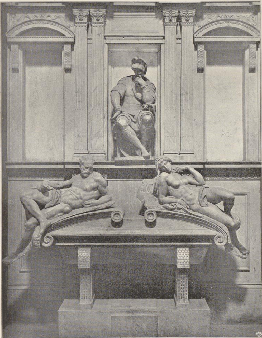
Denkmal des Lorenzo de' Medici in San Lorenzo zu Florenz.