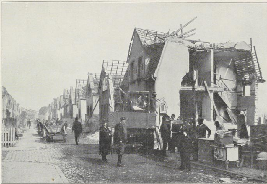
Abbildung 4 Austraße mit den Oppauer Typenhäusern.