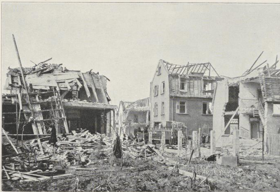
Abbildung 9 Kreuzung der Au- und Blumenstraße.