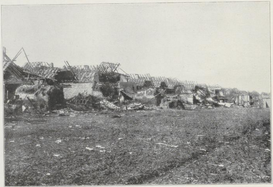
Abbildung 2 Die dem Explosionsherd am nächsten gelegene Austraße. Auch die Gärten sind vollständig verwüstet.