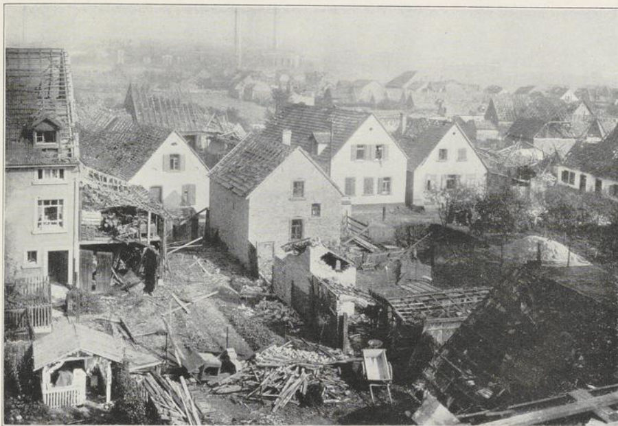
Abbildung 16 Welschstraße.