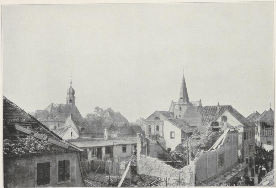
Abbildung 18 Friesenheimer Straße mit Blick auf beide Kirchen.