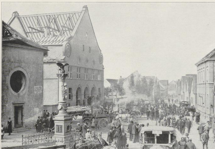
Abbildung 17 Rathausplatz mit Feldküchen zur Verpflegung der Bevölkerung.