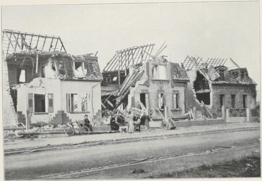
Abbildung 10 Rheinstraße nach der Aufräumung.