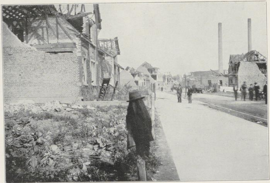
Abbildung 11 Rheinstraße mit den beiden stehengebliebenen Kaminen des Anilinwerks.