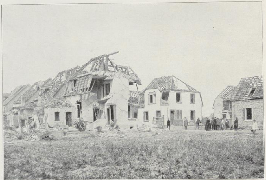
Abbildung 3 Kreuzung der Garten- und Austraße.