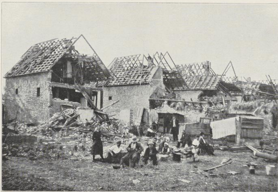
Abbildung 5 Häuser in der Austraße, Gartenseite.