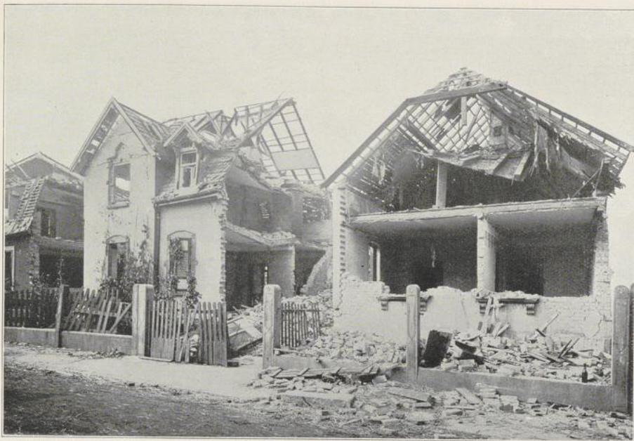
Abbildung 8 Austraße. Gebäude mit schlechten Mauer- und Dachkonstruktionen.