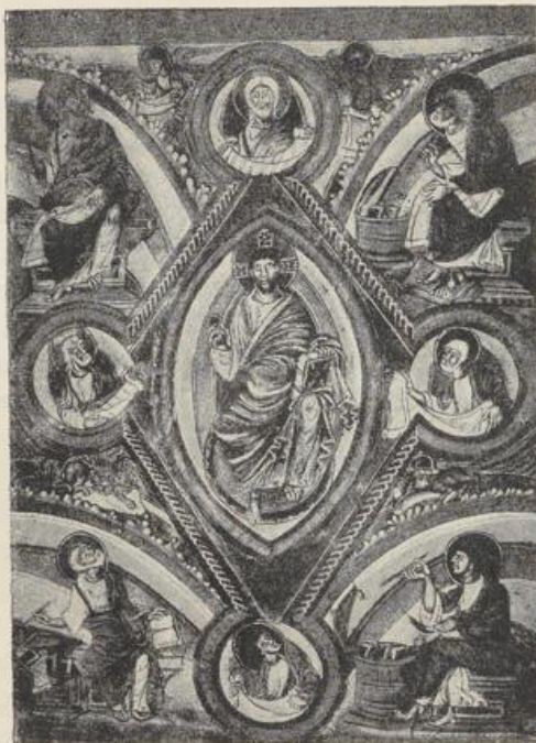
Fig. 11. Codex aureus in Trier.

Die Technik ist meist Deckfarbenmalerei auf rötlicher oder brauner Vor-