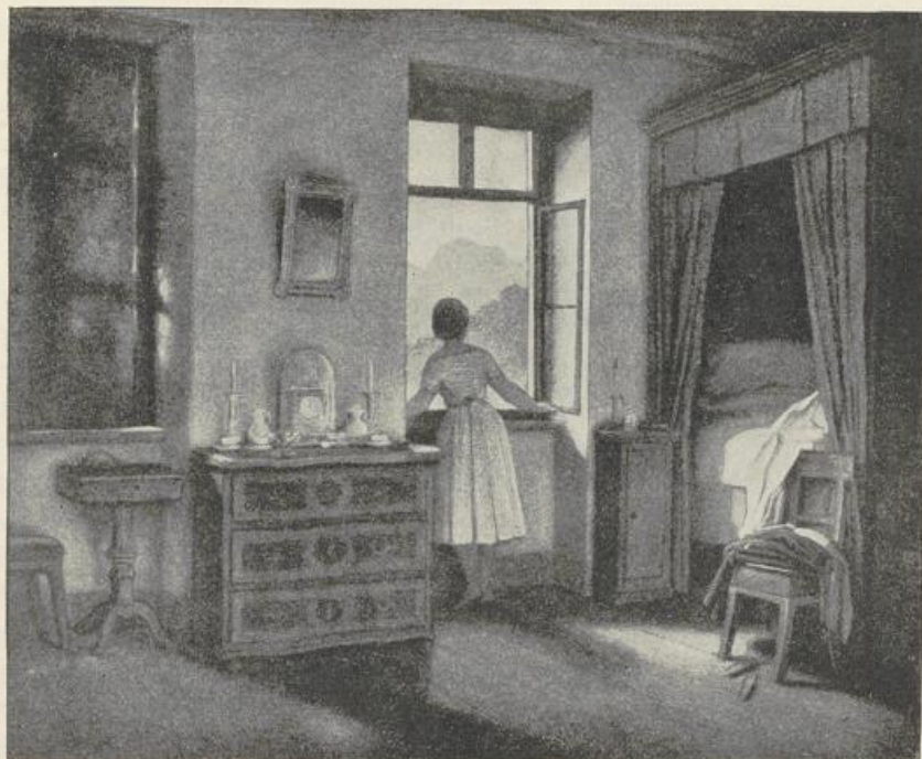
Fig. 418. Moritz von Schwind. Morgenstunde.

Für die Münchner Bilderbogen zeichnete Schwind eine Anzahl Blätter teils humoristischer, teils ernster Art, wie z. B. den Bogen mit dem Thema „Von der Gerechtigkeit Gottes“. Er radierte auch einige Cyklen, wie „Pfeife