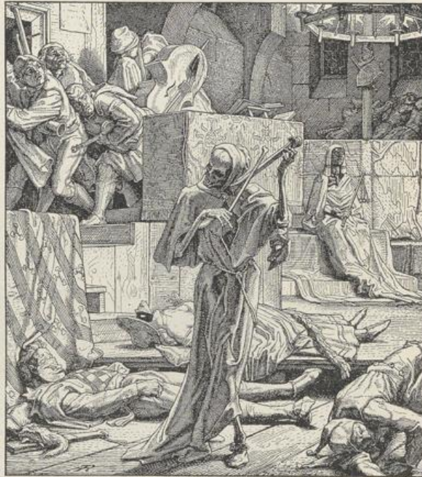
Fig. 416. Alfred Rethel. Der Tod als Bürger.