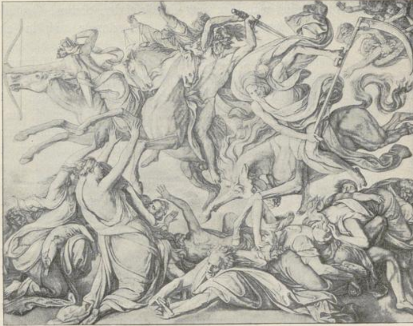
Fig. 411. Peter v. Cornelius. Die apokalyptischen Reiter.

Akademie, wo ihm aber vom Direktor der Akademie jedes Talent abgesprochen wurde. Seine ersten Arbeiten waren die grau in grau gemalten Chorgemälde in der Quirinuskirche zu Neuß und eine heilige Familie für den Fürsten-Primas von Dalberg, die er in Frankfurt malte. Hier entwarf er auch seinen Cyklus von Zeichnungen zu Goethes Faust und die dann in Rom vollendeten Zeichnungen zu den Nibelungen. Bei diesen beiden Folgen hatte er sich im Stile an Dürer und die altdeutschen Meister angeschlossen. Trotz vielen Mängeln in der Zeichnung sind die Blätter doch schon ein Beweis seiner großen, zum Dramatischen hinneigenden Phantasie.