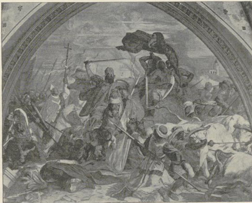
Fig. 415. Alfred Rethel. Die Schlacht bei Cordoba.