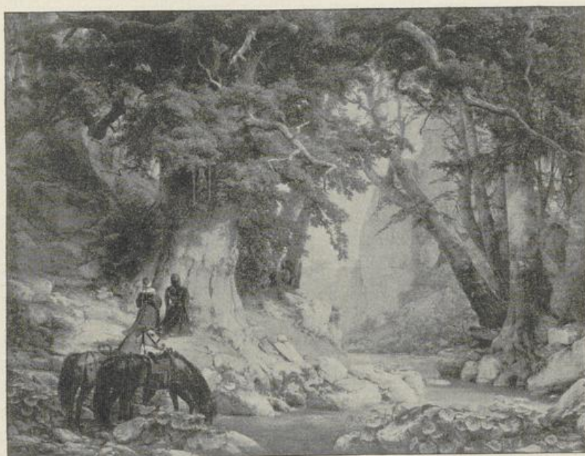
Fig. 414. Lessing. Romantische Landschaft.

zwischen Luther und Eck zu Leipzig" und „Luther verbrennt die päpstliche Bulle" großartige Erfolge errungen und seinen Namen zu einem der vielgenanntesten in Deutschland gemacht. Auch rein malerisch genommen bedeuten diese Bilder einen großen Fortschritt. Die besondere Bedeutung Lessings liegt aber auf dem Gebiete der Landschaft. Anfänglich suchte er seinen Landschaften durch die Staffage eine erhöhte romantische Stimmung zu geben; er belebte sie mit Rittern (Fig. 414), Soldaten aus dem Dreißigjährigen Kriege, Mönchen und Nonnen. Später ließ er dieses Beiwerk, das früher oft die Hauptsache war, weg, nur die düstere, zuweilen wehmütig ernste Stimmung seiner Landschaften behielt er bei. Mit Vorliebe malte er einsame