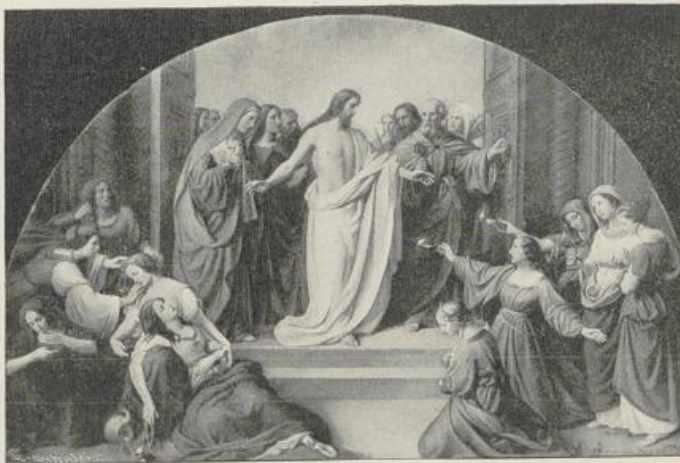
Fig. 412. Schadow. Die klugen und die törichten Jungfrauen.

Es erblühte unter Schadow ein reiches, mannigfaltiges Kunstleben, dem die verschiedenen Einflüsse von Holland, Frankreich und England einen eigenartig buntfarbigen Charakter gaben. Es wurden die monumentale romantische Historienmalerei religiöser und weltlicher Richtung, das historisch romantische Genrebild und das bürgerliche Sittenbild hier ebenso gepflegt wie die Landschaftsmalerei und die Bildniskunst.