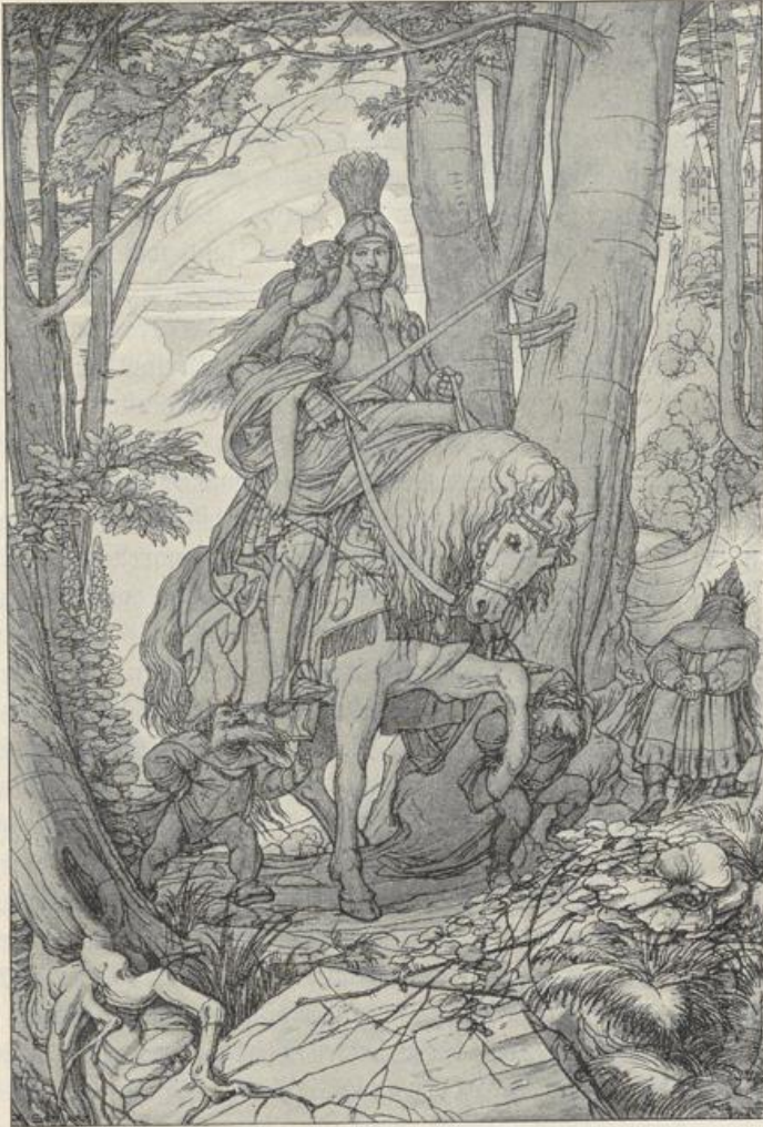
Fig. 409. E. v. Steinle. Wer das Glück hat, führt die Braut heim.

Führichs erste größere Arbeit waren fünfzehn Zeichnungen zu Tiecks Genoveva , dann radierte er neun Blätter Vaterunser , die sieben Bitten und elf Blätter Triumph Christi . In Holzschnitt erschienen die Illustrationen der