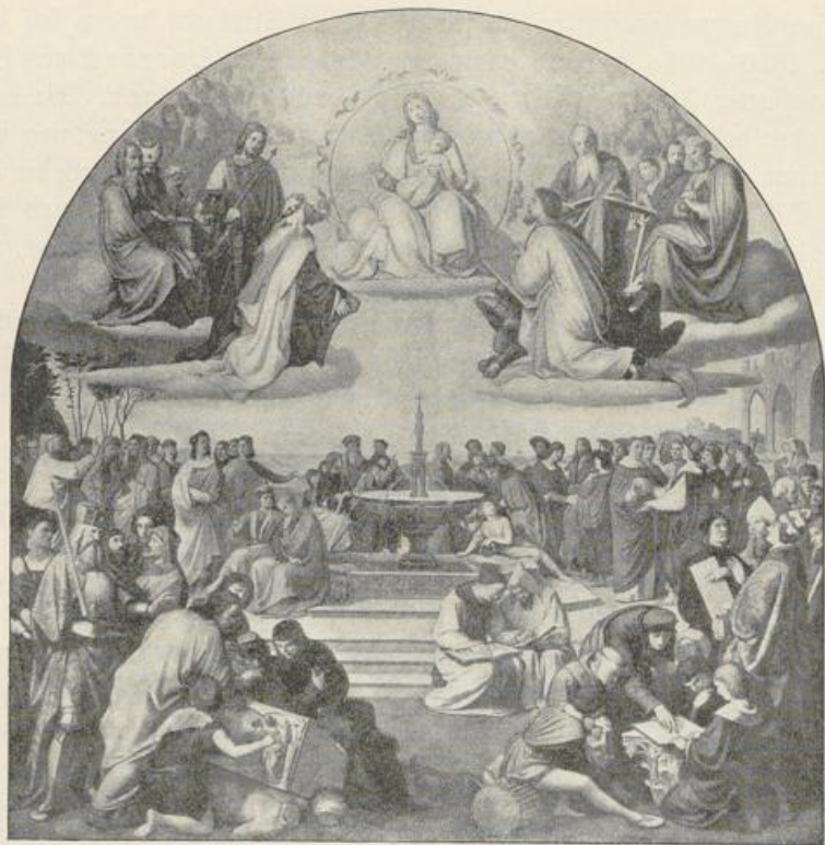
Fig. 407. Friedrich Overbeck. Magnificat der Künste.

Ariost wurde Julius Schnorr von Carolsfeld übertragen, der erst 1817 nach Rom gekommen war.