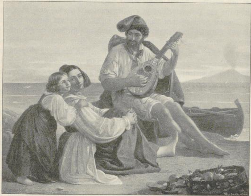
Fig. 423. A. Nibel. Neapolitanische Fischerfamilie.

Auch Christian Morgenstern (1805—1867), hauptsächlich in München tätig, und Louis Gurlitt (1812—1897), die beide eine Zeitlang an der Akademie in Kopenhagen studiert und auf großen Reisen sich weitergebildet haben, waren vortreffliche Landschaftsmaler, die treue Wiedergabe der geschauten Natur mit großer Auffassung verbanden. Morgenstern war in den dreißiger Jahren nach München gekommen und hat dort Bilder gemalt, in denen er uns die Schönheiten, die Licht und Luft auch einem ganz unscheinbaren Stück Flachland verleihen können, zeigt.