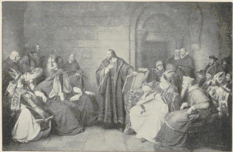
Fig. 413. Lessing. Hus vor dem Konstanzer Konzil.