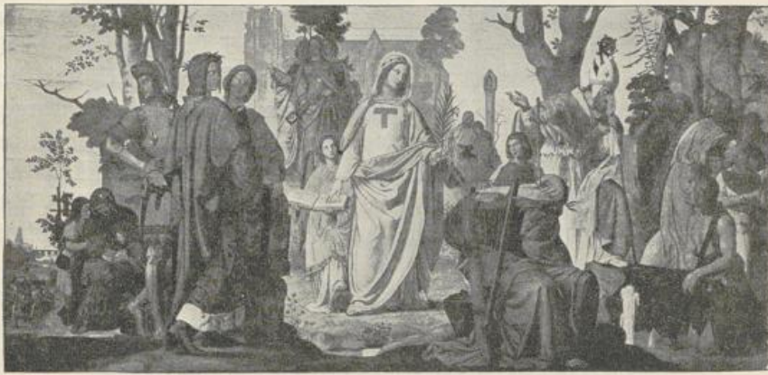
Fig. 408. Ph. Veit. Die Einführung der Künste in Deutschland.

Außerordentlich groß war der Einfluß, den seine Bilder im ganzen katholischen Deutschland ausübten, ungeheuer war deren Verbreitung in Nach-