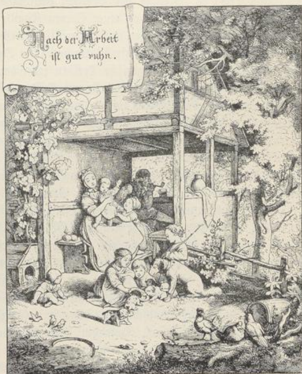
Fig. 420. Adriaen Ludwig Richter. Holzschnitt.

Gemütlicher als er hat keiner die deutsche Stube mit dem warmen Kachelofen, an dem Großvater mit dem Pfeifchen im Munde sitzt und den Enkeln Geschichten erzählt, den Garten am Hause mit dem bescheidenen Blumenflor oder die Gassen der kleinen Städtchen mit dem anheimelnden, kleinbürgerlichen Getriebe wiedergegeben.