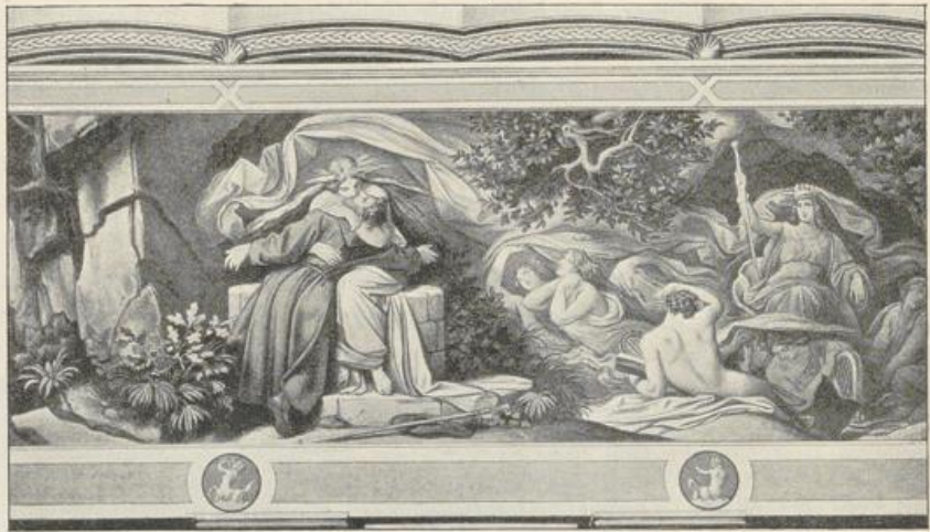
Fig. 417. M. v. Schwind. (Die schöne Melusine.) Das Wiederfinden.

Zahlreich sind die Fresken, Oelgemälde, Aquarelle und Zeichnungen Schwinds, namentlich für den Holzschnitt; auch Radierungen hat er herausgegeben. In München malte er in der Residenz eine Anzahl Fresken nach Tiecks Dichtungen, im Schlosse Hohenschwangau Szenen aus der Dietrichsage. Im Jahre 1839 wurde er vom Großherzog von Baden nach Karlsruhe berufen, das Treppenhaus der Kunsthalle mit Fresken zu schmücken. Als Hauptbild malte er die Einweihung des Freiburger Münsters. In der Karlsruher Galerie selbst ist das launige Bild „Ritter Kurts Brautfahrt“. 1844 malte er dann in Frankfurt a./M. für das Städel'sche Institut das Oelgemälde „Der Sängerkrieg auf der Wartburg“. Das gleiche Thema wiederholte er auf der Wartburg selbst, wo er auch seine berühmten Bilder aus dem Leben der heiligen Elisabeth und die sieben Werke der Barmherzigkeit malte. Auch für die Wiener Hofoper entwarf er eine Reihe von Bildern, Szenen aus der Zauberflöte.