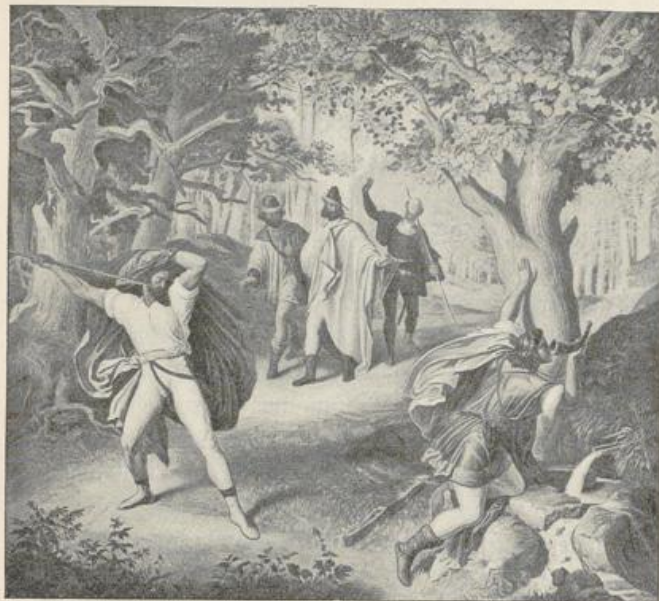
Fig. 410. Schnorr v. Carolsfeld. Siegfrieds Tod.

Von seinen Tafelbildern seien die Bekehrung Pauli in der Dresdener Galerie, deren Direktor Schnorr seit 1848 war, Luther in Worms im Maximilianeum in München und der Erbkönig in der Schackgalerie genannt. Am bekanntesten ist der Künstler durch seine Bilderbibel geworden, die trotz dem oft etwas leeren Pathos und der konventionellen Zeichnung doch