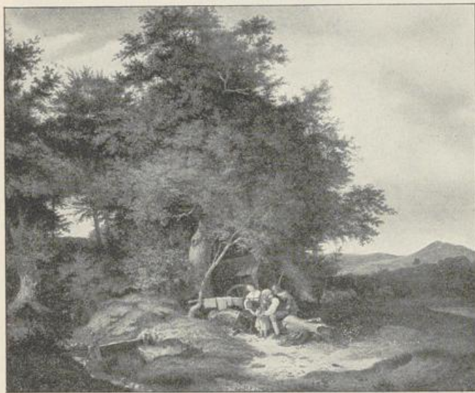
Fig. 419. Adrian Ludwig Richter. Waldlandschaft im Herbst.

Von seinen Oelgemälden, die sich jetzt meistens in öffentlichen Galerien befinden, seien genannt „Die Ueberfahrt am Schreckenstein“, ein Bild