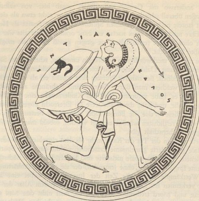
Krieger mit Schild von Pfeilen bedrängt (Innenbild einer Kylix)

Die nächste Parallele in der Geschichte bietet wohl der Rat der Zehn in Venedig, ebenfalls alljährlich durch die ganze regierende Kaste gewählt und mit ebenso unbedingten Vollmachten ausgestattet. Nur genügte es in Venedig, Versuche zur Tyrannis, Verschwörungen verarmter Nobili und Gefahren von außen abzuschneiden, Sparta dagegen hatte mit der Zeit nicht nur ebenfalls seine verarmten Dorer, sondern die große innere Gefahr von seiten der Periöken und Heloten auf dem Nacken. Venedig hatte den Gehorchenden ihr Eigentum gelassen, Sparta ihnen das Meiste und Beste geraubt; Venedig war von seinen Untertanen in Stadt und Gebiet geliebt, Sparta entsetzlich gehaßt; Venedig begehrte im Grunde nach außen nicht mehr Macht zu haben, als es zu seiner Sicherheit bedurfte; Sparta übte eine bedrohliche auswärtige Politik und mußte die Abhängigkeit der übrigen Griechen wünschen, damit dieselben nicht auf seine Unterworfenen einwirkten. Vom Ephorat wird wohl das neue, raffinierte Sparta wesentlich ausgegangen sein, ein ganz besonderer Höhepunkt der vollendeten griechischen Polis, mit völliger Gleichheit aller Bürger in Sitte und Bildung, mit möglichster Aufhebung des individuellen Lebens, des κατ' ἰδίαν ζῆν, mit Fülle der Muße, mit Verachtung des Erwerbes, mit ausschließlicher Betreibung dessen, was den Staaten Freiheit bringt. Von allen Poleis erstrebte, heißt es, nur Sparta von Staats wegen das, was das allgemeine Ideal der Hellenen war, die Kalokagathie.