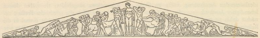
Giebelgruppe des Zeustempels in Olympia (Westen) Rekonstruktion nach Treu von Kurt Lange