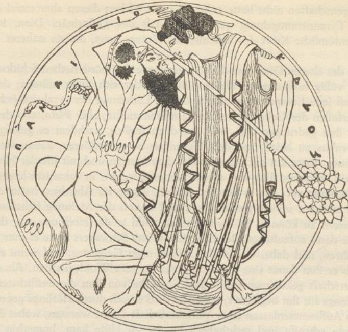
Silen mit Bacchantin (Innenbild einer Trinkschale)

syrakusanische Hilfe genossen, das Bürgerrecht, was freilich nach Leuktra nicht mehr viel bedeuten wollte; auch in die eleusinischen Mysterien wurde er eingeweiht, und sein Mysterienpate war Kallippos , sein athenischer Gastfreund und späterer Mörder.