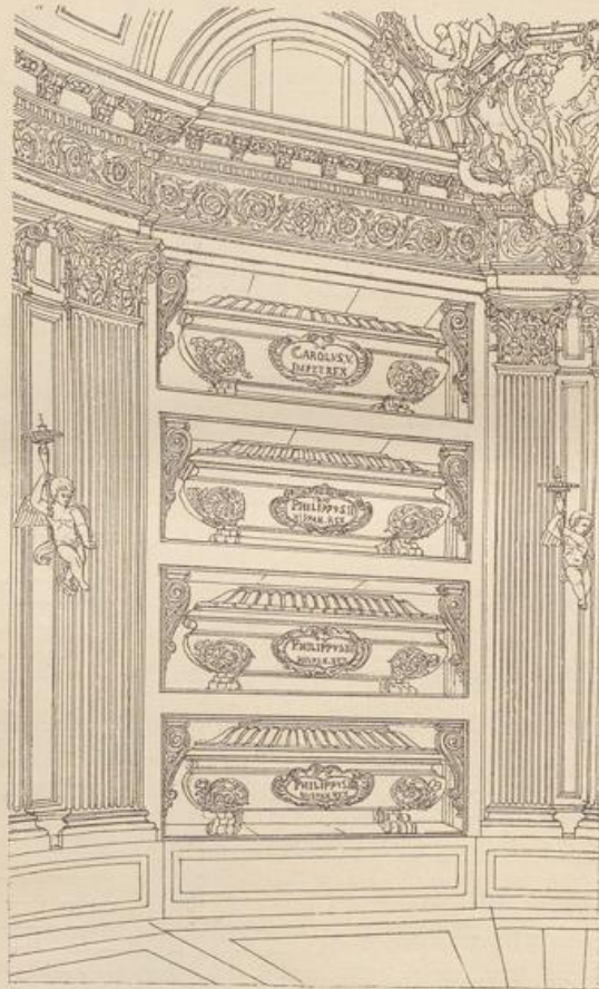
Fig. 147. Escorial. Wand vom Pantheon der Könige.

1611 begonnen und 1616 vollendet, ein ernstes einfaches Gebäude von kleinen Abmessungen, ohne Luxus; dann die Süd façade am alten königlichen Schlosse in Madrid und die Klosterkirche von San Gil. Letztere beiden Bauwerke existiren nicht mehr. Auch der Palast de la Panaderia (Bäckergewerk), auf der Plaza mayor zu Madrid, ist 1790 durch Brand untergegangen. Ausserdem von Juan