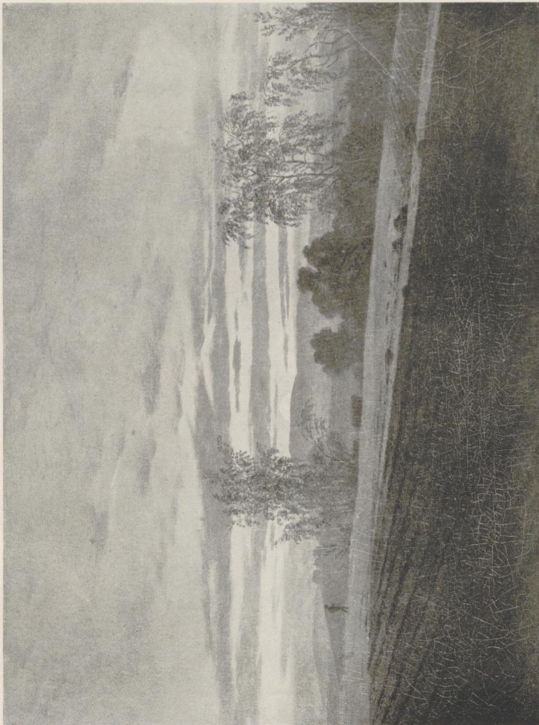
13 Caspar David Friedrich, Sturzaeker . 1820—1830. Hamburg, Kunsthalle