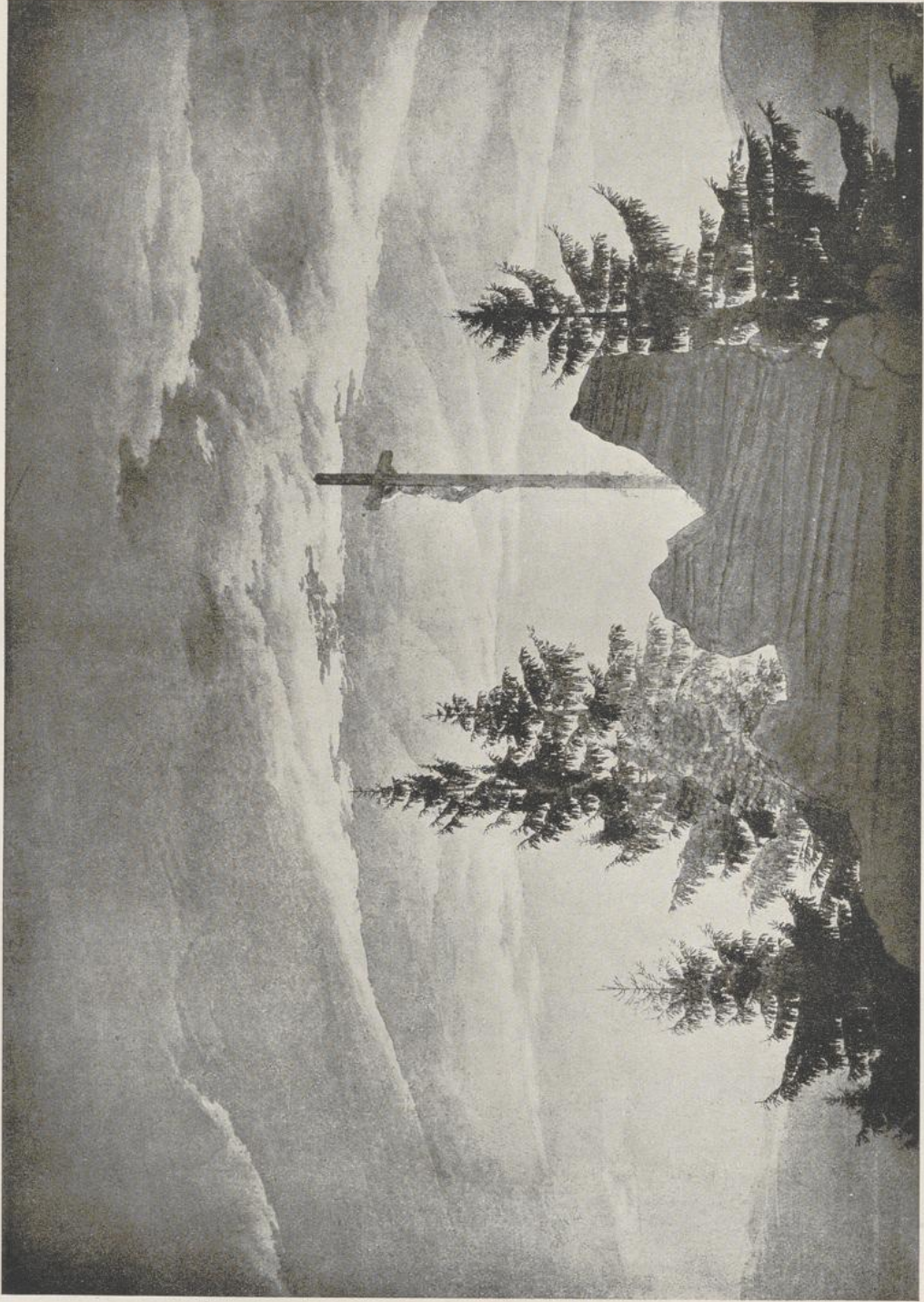
12 Caspar David Friedrich, Das Kreuz im Gebirge. Um 1808/09. Berlin, Nationalgalerie