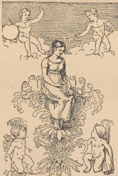
Natur. Federzeichnung von Philipp Otto Runge, 1810.

Ein frischer Mut ist immer das beste, und wenn wir eine Sache nur recht wollen, so will sie uns auch. 9. Juli 1808