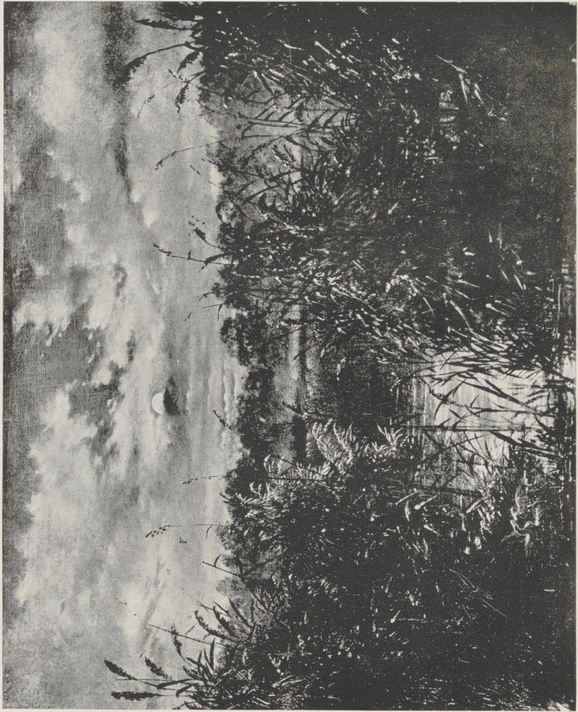
6 Carl Gustav Carus, Mondnacht im Schilf. Verbrannt im Glaspalast München