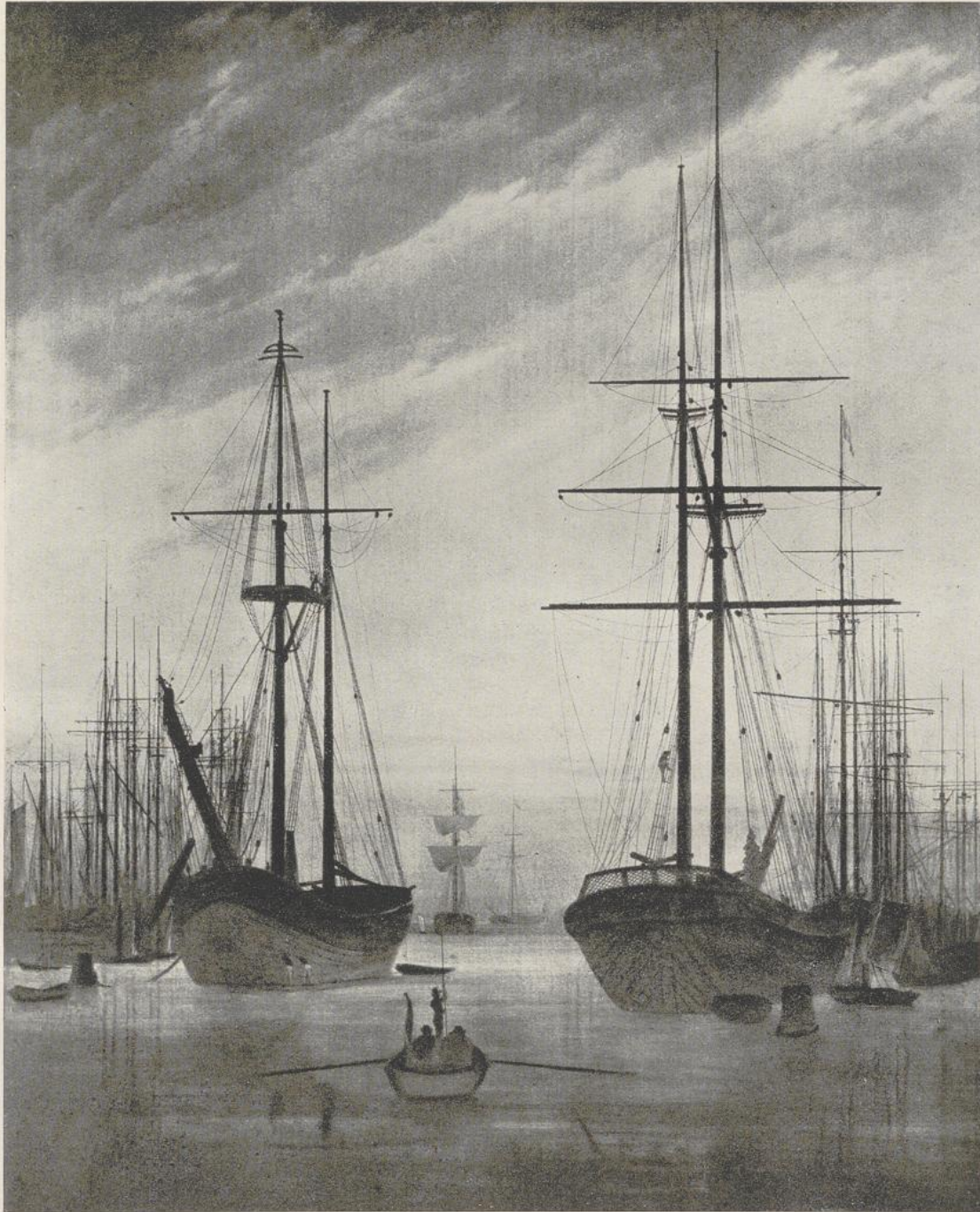
15 Caspar David Friedrich, Hafen von Greifswald . Berlin, Schloßmuseum