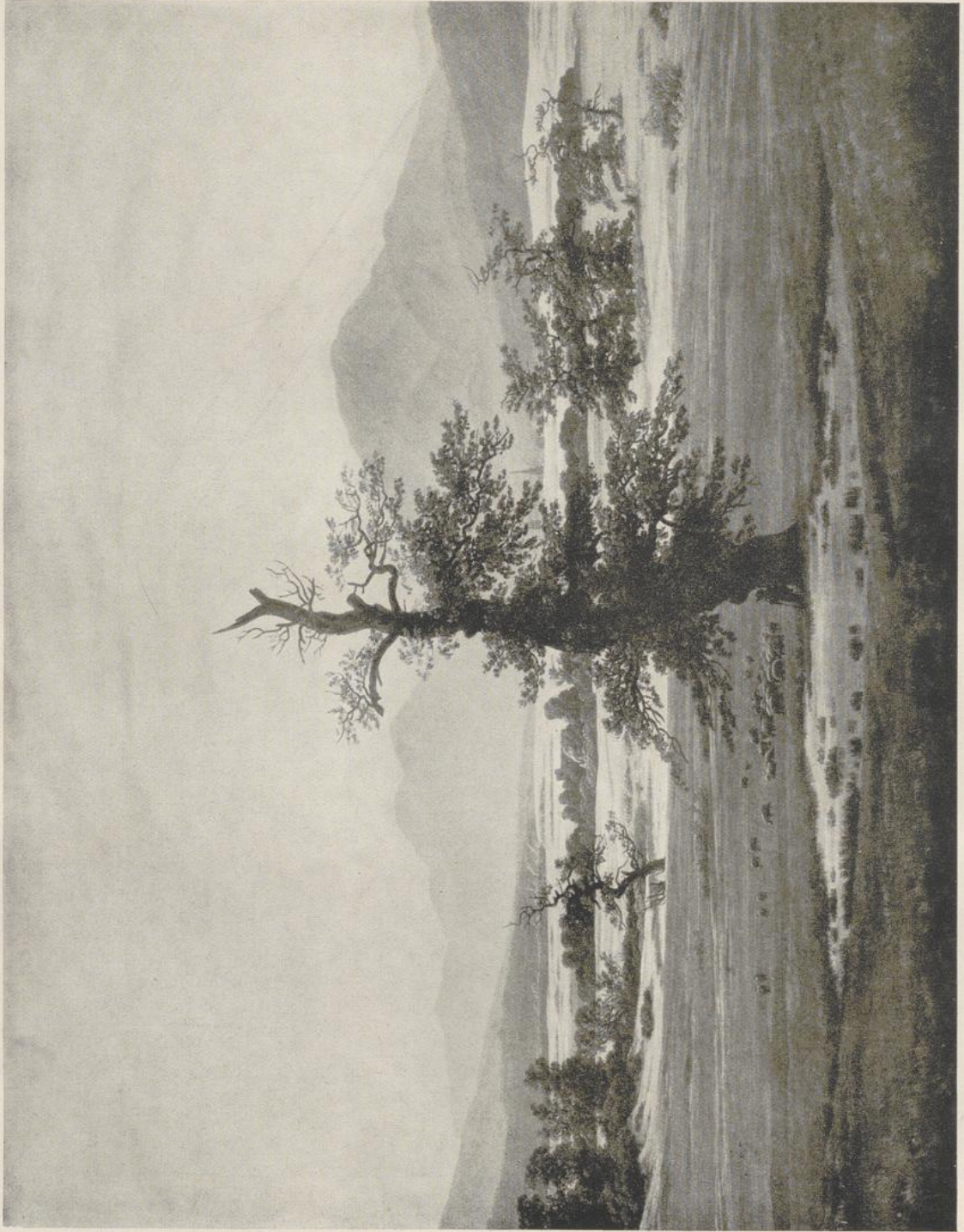
16 Caspar David Friedrich, Einsamer Baum . Berlin, Nationalgalerie