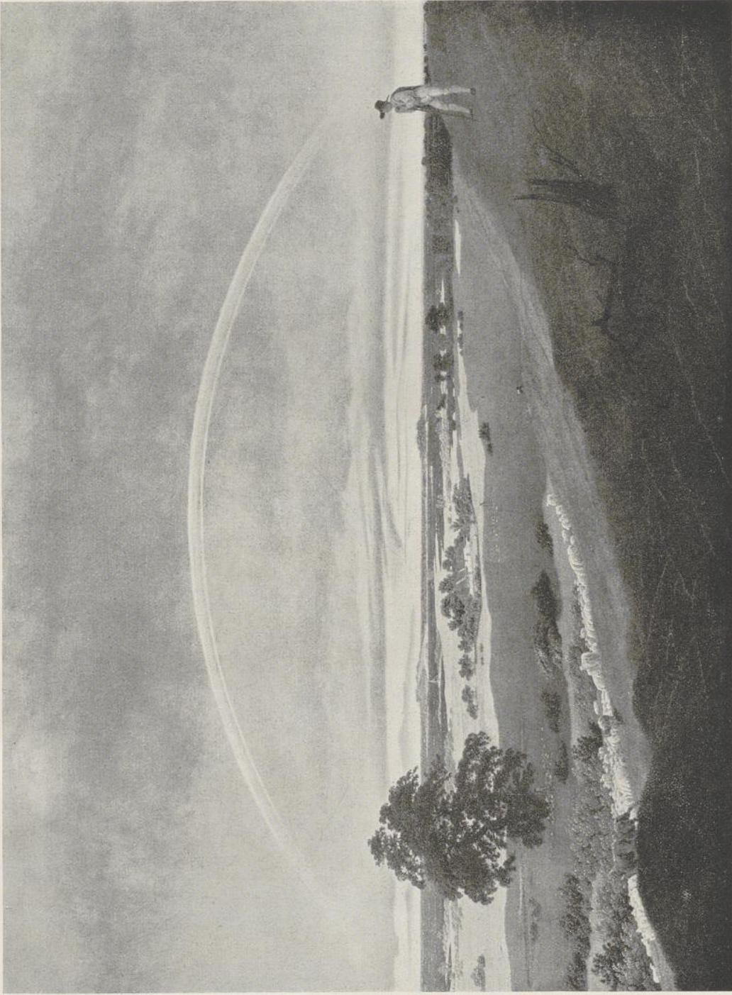
11 Caspar David Friedrich, Die Landschaft mit dem Regenbogen. Um 1814. Weimar, Staatl. Kunstsammlungen