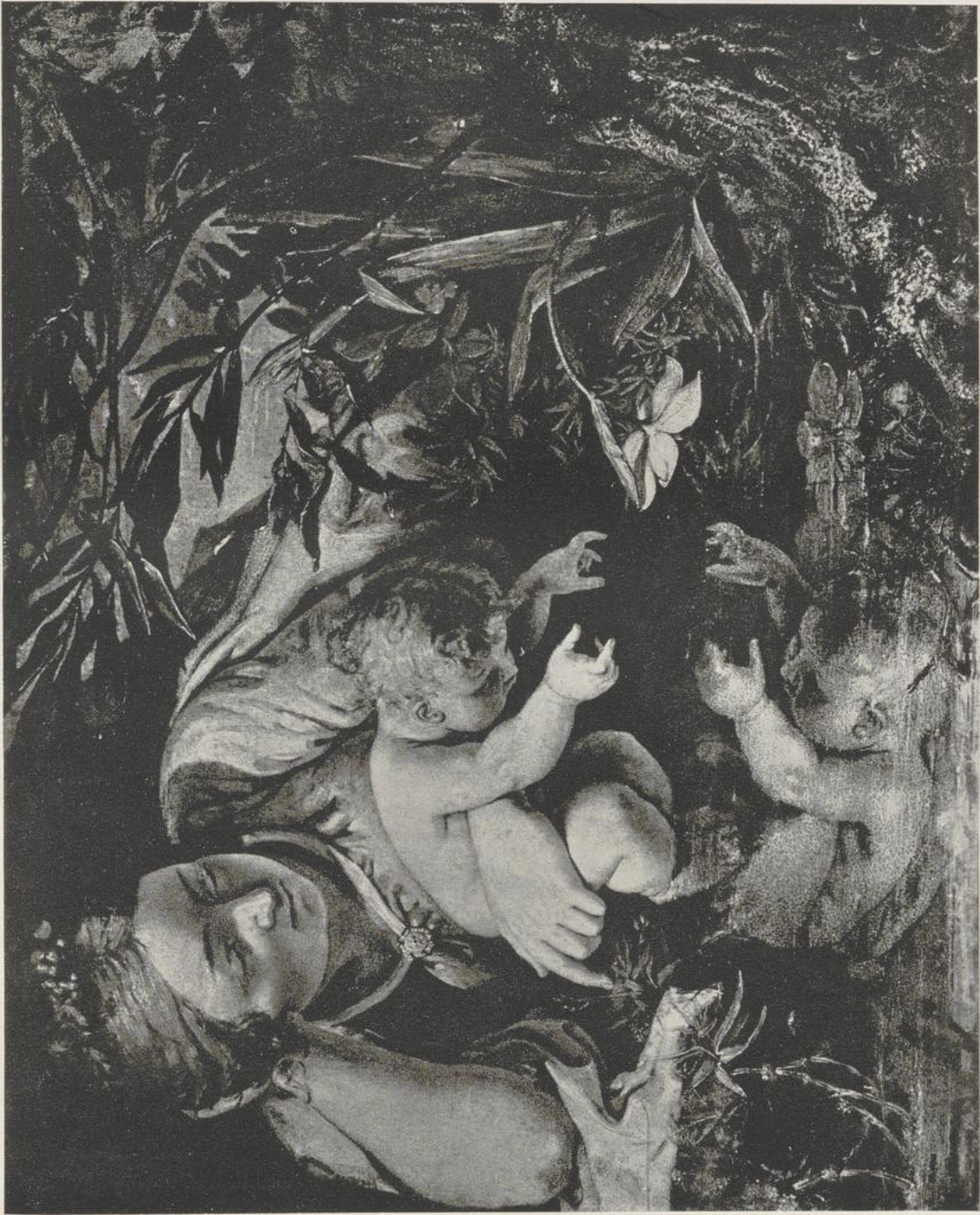
7 Philipp Otto Runge, Mutter und Kind an der Quelle, 1804, Hamburg, Kunsthalle (1931 verbrannt)