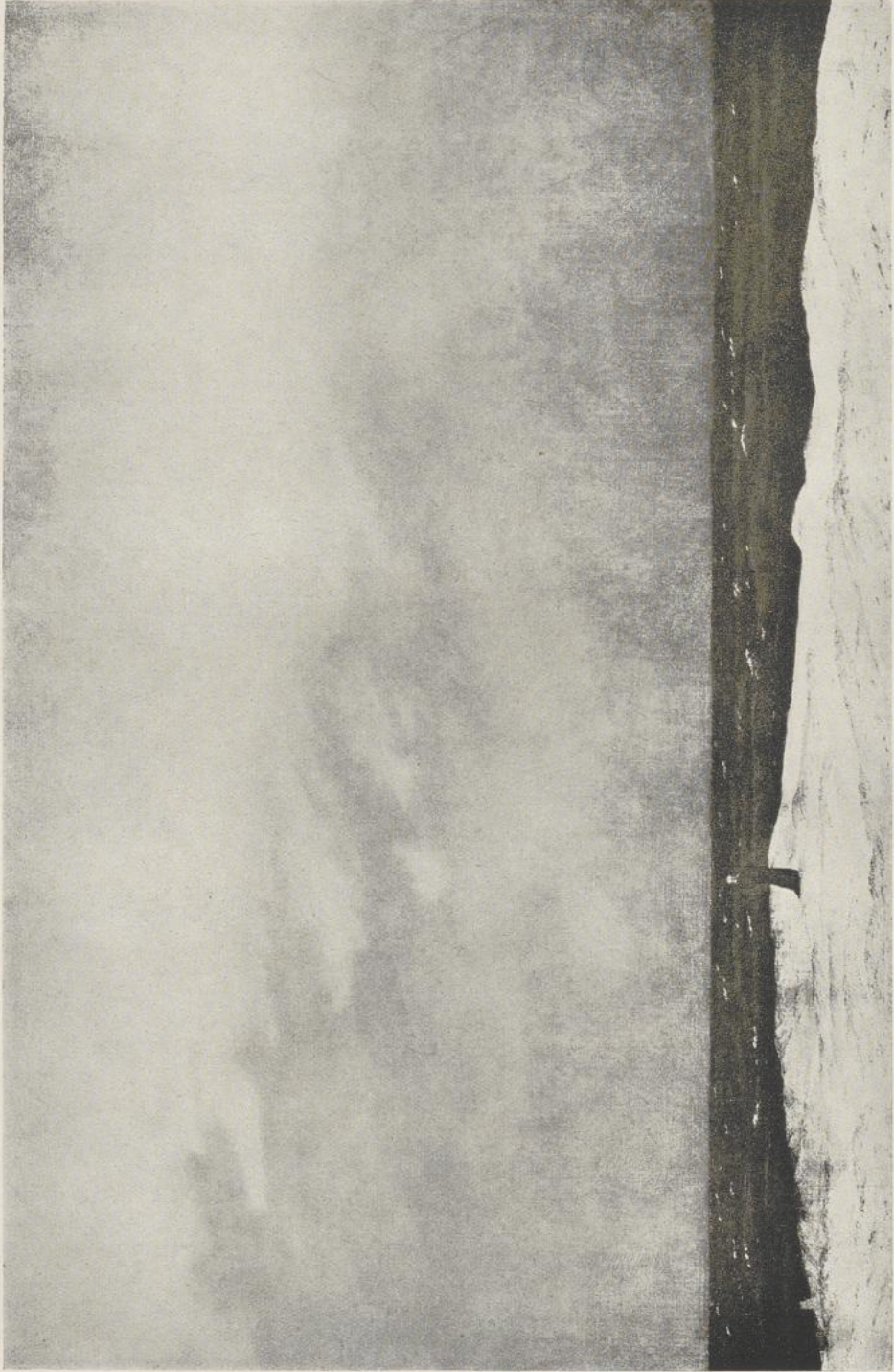
8 Caspar David Friedrich, Mönch am Meer. 1810. Berlin, Schloßmuseum