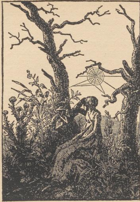
Melancholie Holzschnitt von Caspar David Friedrich