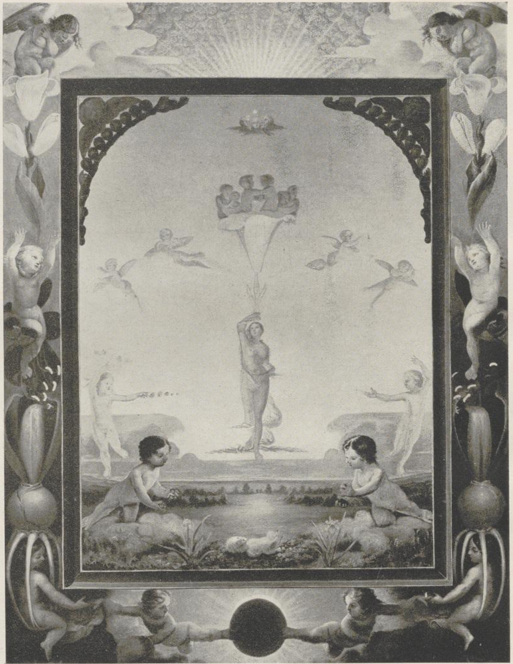
4 Philipp Otto Runge, Der Morgen (erste Fassung) . 1808. Hamburg, Kunsthalle