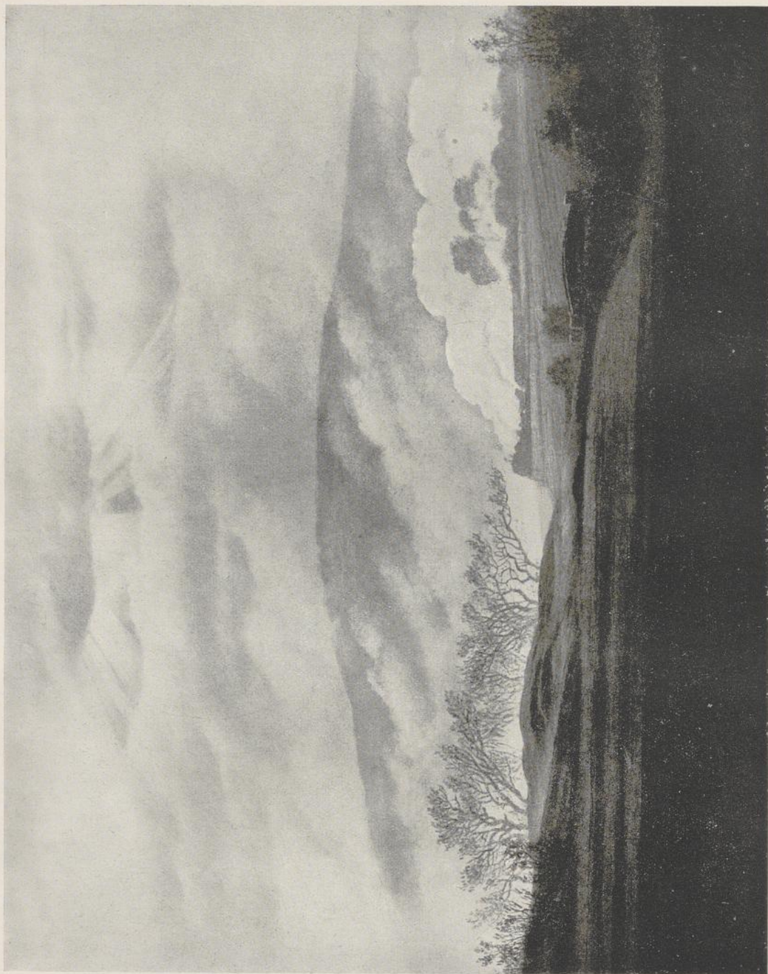
10 Caspar David Friedrich, Nebel wallen im Tal (Elblandschiff) . Berlin, Nationalgalerie