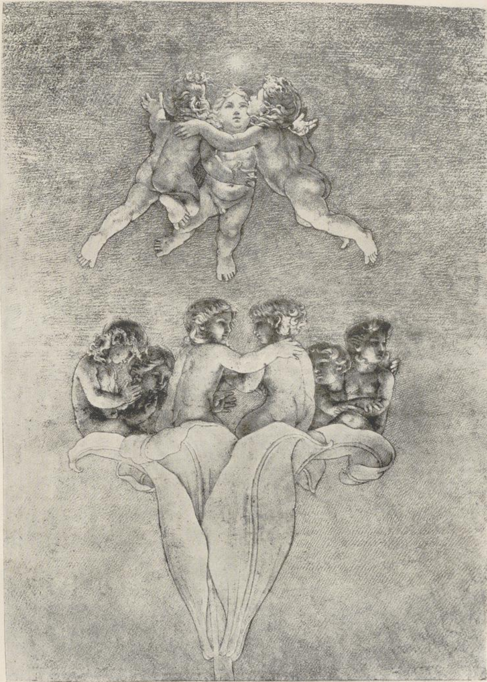
1 Philipp Otto Runge, Die Lichtlilie zum großen Morgen (zweite Fassung) . 1809 Köln, Wallraf-Richartz-Museum