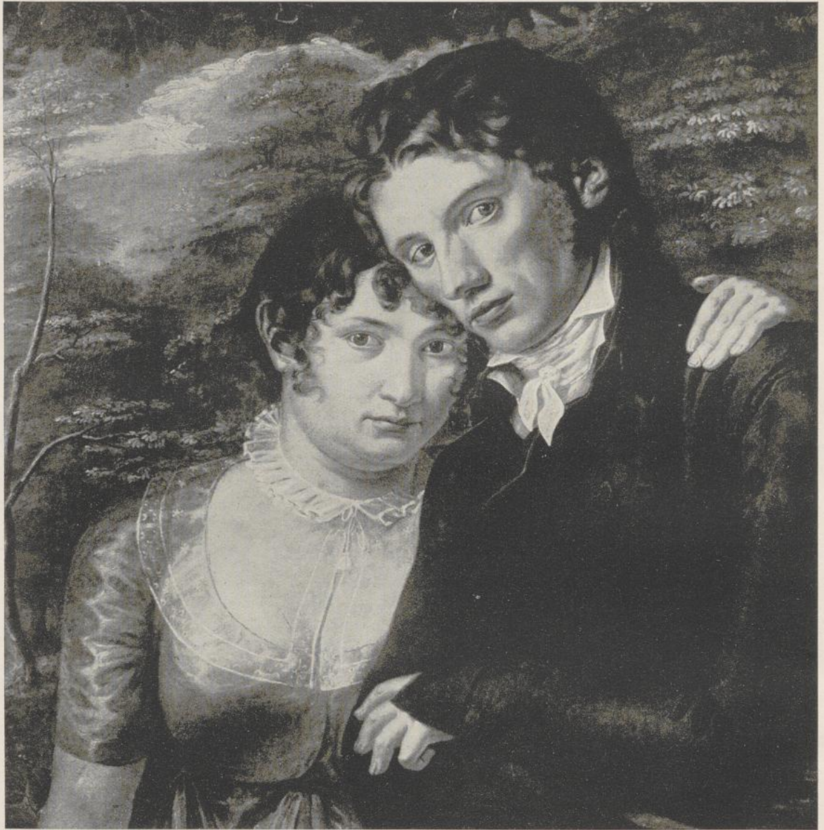
2 Philipp Otto Runge, Wir Drei (Ausschnitt: Selbstbildnis mit seiner Frau). 1804. Hamburg, Kunsthalle