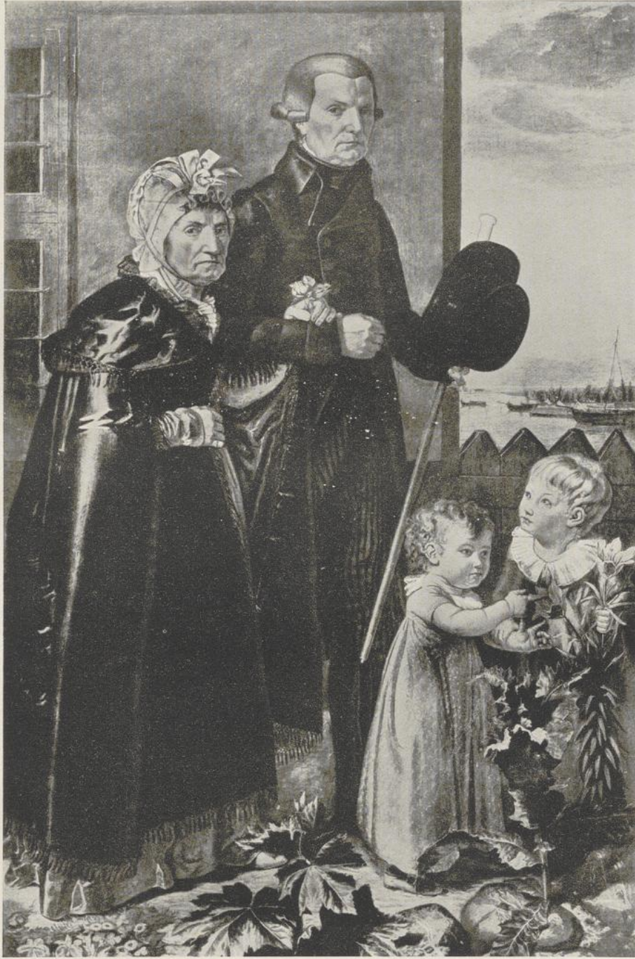
5 Philipp Otto Runge, Die Eltern des Künstlers . 1806. Hamburg, Kunsthalle