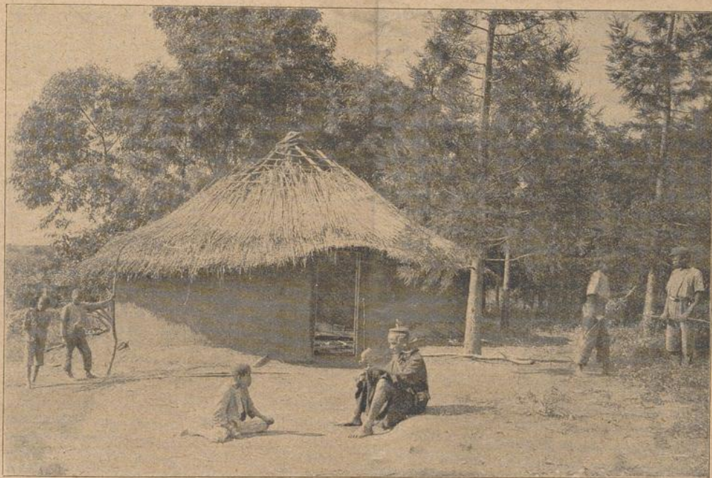
Ein Kaffernheim. (Das primitive Strohdach harret noch der Vollendung.)

Die eingangs erwähnte Boa hatte es auch wohl so machen wollen, aber ihr Gegner selbst scharfe Zähne besitzend, biß die Schlange tot. Diese Schlange war in der Dicke noch wenig entwickelt.