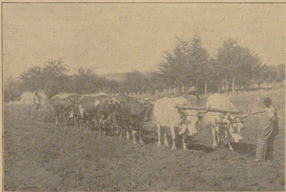
Kaffern beim Pflügen.

„Aber doch nicht für mich! Ich weiß ja noch nichts, als daß ich auf lateinisch clamor validus heiße; ist's recht, Frau Mutter?“ Roswitha neigte schelmisch lächelnd das Köpfchen an die Kante der offenen Türe.