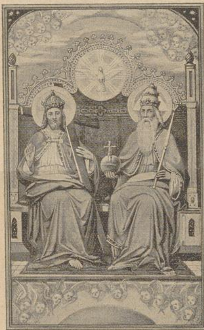
Die hl. Dreifaltigkeit.

Die Vermählung des heiligen Joseph mit der allerseeligsten Jungfrau Maria fiel auf den 23. Januar. Sie wurde in Jerusalem am Berge Sion in einem eigens für solche Feste parat gehaltenen Hause gehalten.