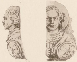
VON EINEM PFEILERKAPITÄL