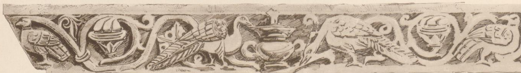
VON DER MITTELTÜR BIS ZUR HAUPTKIRCHE