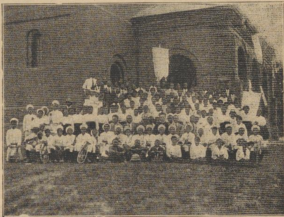
Reichenauer Musikkapelle und Sängerchor

Würziger Tannenduft empfängt am Weihnachtsmorgen die Familie in der Wohnstube. In einer Fülle von Licht erstrahlt der Christbaum, übersät von glitzerndem Sternengold und allerlei Süßigkeiten. Da leben jung und alt wieder auf und erfreuen sich all der Herrlichkeit und schimmernden