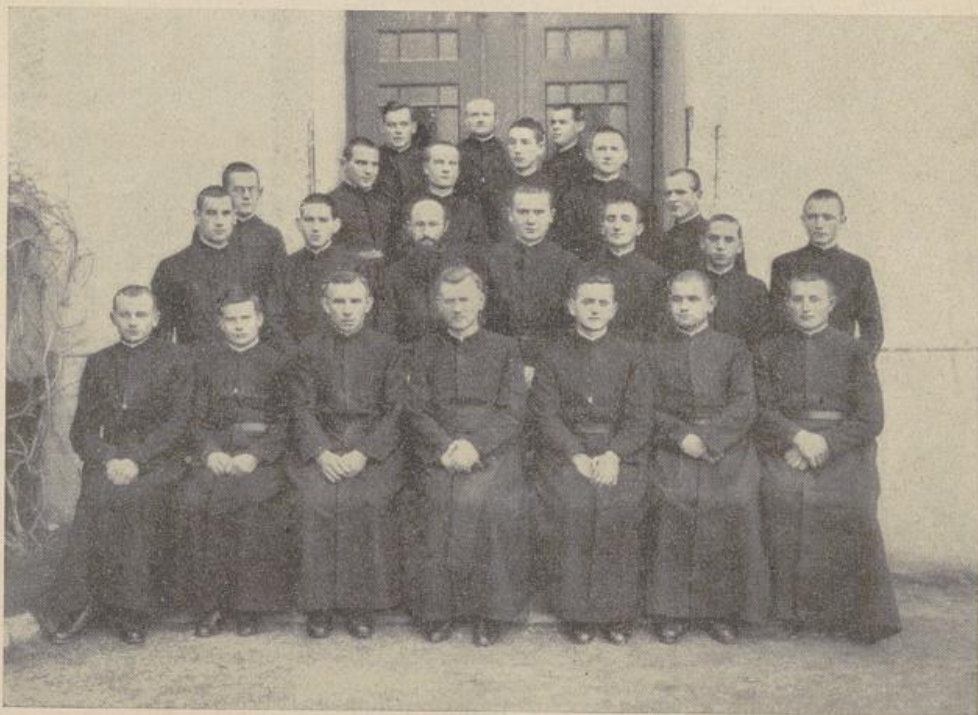
Gruppe von Missionsbrüdern, die am hl. Weihnachtsfest (1936) im Missionshaus St. Joseph, Reimlingen, ihre Gelübde ablegten