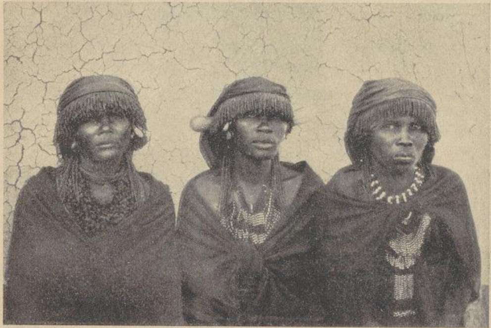
Eingeborene Frauen (Amabaca)