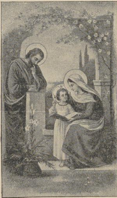
Die hl. Familie.

Heute nun hat ich den Beichtvater, diesen Befehl auf Latein und ganz leise auszusprechen, worauf