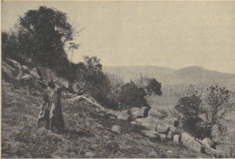
Landschaft bei Cîteaug

Wildnis sind nicht ungefährlich mit ihrem fürchterlichen Gebiß, starken Vierhänderkrallen und von Statur etwa wie Bernhardinerhunde. Die Räuber der Maisfelder und Schrecken der Schaffarmer könnten mit Leichtigkeit Menschen umbringen. Einmal kam ich dort ganz allein des Weges, ohne Schuß und Waffe. Von der Felsenmauer herab stiegen drei dunkle Ungetüme mir entgegen. Zähnefletschend, mit drohenden Gebärden kamen sie näher und näher. Ich tat als ob ich sie nicht bemerkte und hütete mich wohl, etwa Steine nach ihnen zu werfen. Die drei Baboons hätten es wahrscheinlich mit mir aufgenommen und hatten von oben herab weit mehr Kraft und Steine zur Verfügung. So aber ließen sie es bei harmlosen Annäherungsversuchen und Grimassen bewenden. Friedlich zog ich meine Straße weiter in der menschenleeren Wildnis.