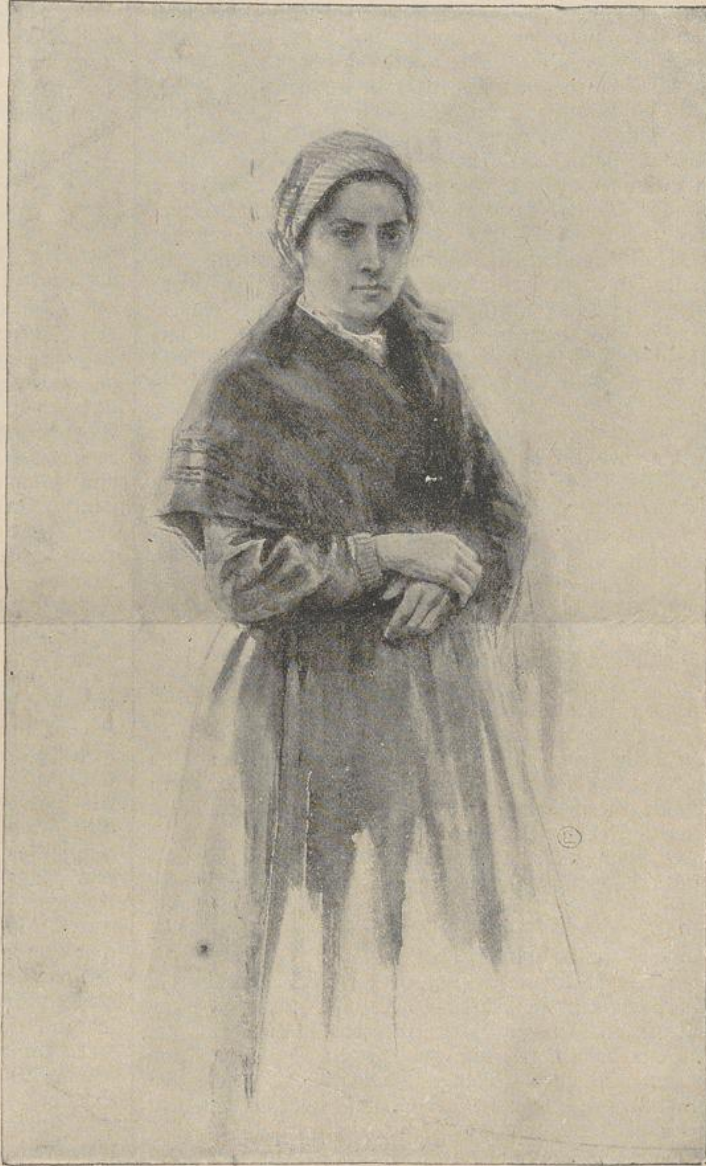
Bernadette von Lourdes.

mich wohler als Chef einer großen Partei, denn als Ministerpräsident; denn ich bin viel mächtiger als er. Als wir von der Entchristlichung Frankreichs sprachen, war es, als ob die Steine sich gegen uns erheben wollten, so fest schien der 20. Jahrhunderte alte Bau der katholischen Kirche in der französischen Idee festgewurzelt zu sein. Aber die Sache ging viel